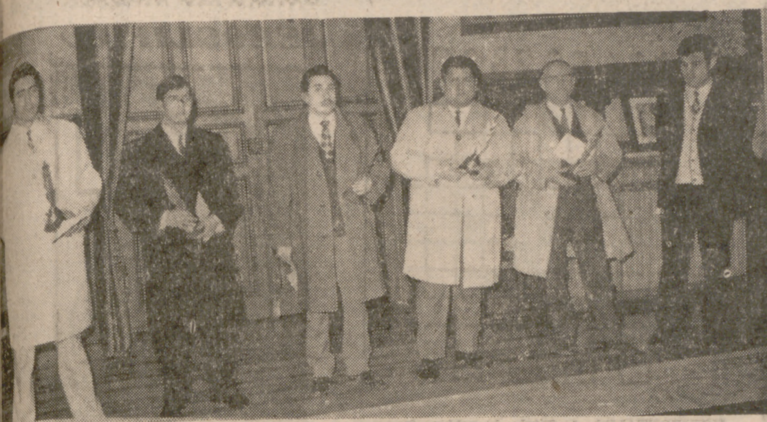
Los premiados, con los galardones obtenidos.

En el despacho del Alcalde tuvo lugar el acto de entrega de los premios del Concurso de Escaparates, que fue organizado por el Ayuntamiento y la Asociación Belga Castellana.