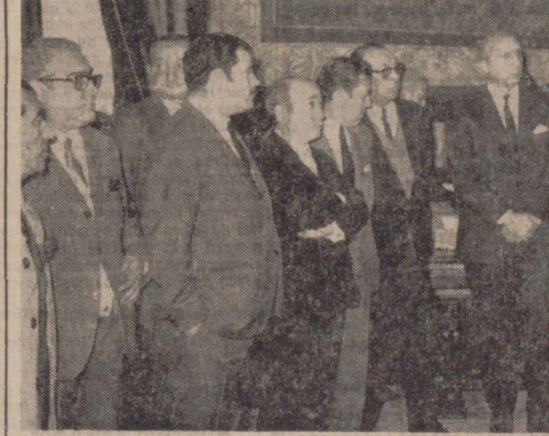
Visitando al Alcalde, a primeras horas de la tarde de ayer.

Los componentes de esta Comisión Permanente del Sindicato Nacional del Metal—más de cuarenta representantes de distintas provincias—realizaron en la mañana de hoy una detenida visita a las factorías de la firma "Fasa-Renault".