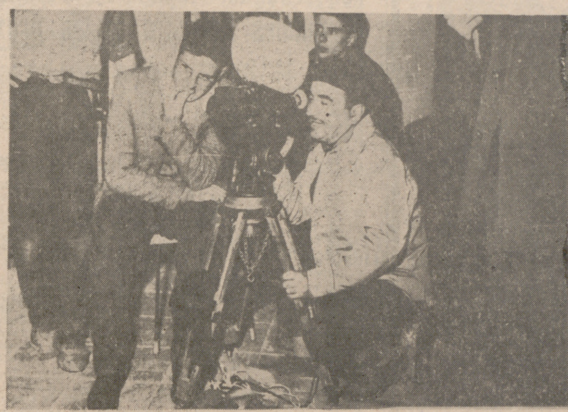
El director Pedro Lazaga rodando "La pandilla de los 11".

La semana pasada, en los alrededores de Madrid, se inició el rodaje de la película "Blanca por fuera, rosa por dentro". Se trata de una adaptación de la obra de Jardiel Poncela, como los seguidores del ingenioso autor habrán imaginado.