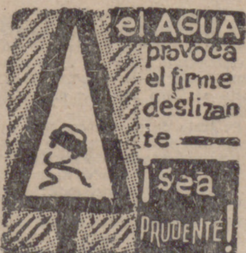
El Agua provoca el firme deslizamiento. Sea prudente!

El plazo de admisión terminará el día 27. Los premios son: Premio de Honor, consistente en una placa de plata grabada y 3.000 pesetas a la mejor colección; un segundo para la colección de siga en méritos, con medalla grabada y 2.000 pesetas. Un primer premio, consistente en placa de plata grabada y 2.000 pesetas, a la mejor fotografía; y un segundo, consistente en medalla grabada y 1.000 pesetas, y un tercero de 500 pesetas.