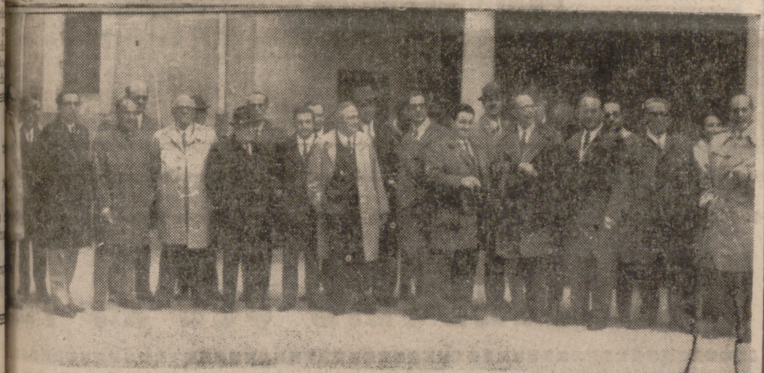
ASISTENTES A LA MISA