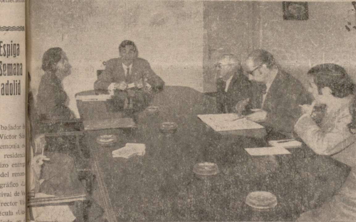
El Delegado de Sindicatos explica a los informadores algunos de los aspectos de los cursos para trabajadores mayores de catorce años.

De momento, parecen suficientes las 19 secciones establecidas para Valladolid y su provincia, pero es muy posible que, con arreglo a los resultados de esta primera etapa y al interés que el anuncio de los cursos haya podido despertar entre los trabajadores mayores de catorce