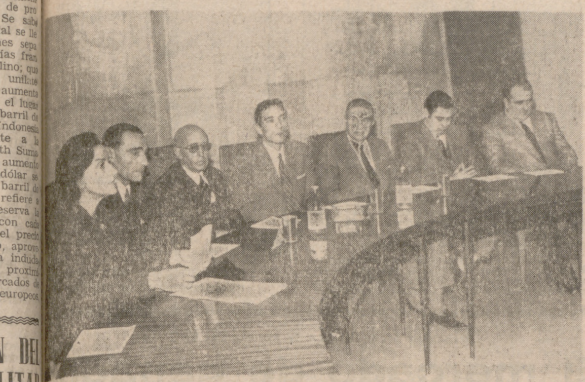
El momento del acto de clausura del curso de actualización de profesores para la promoción cultural del trabajador, celebrado en la Casa Sindical.

Se celebrarán en trece pueblos Diecinueve secciones para seiscientos alumnos