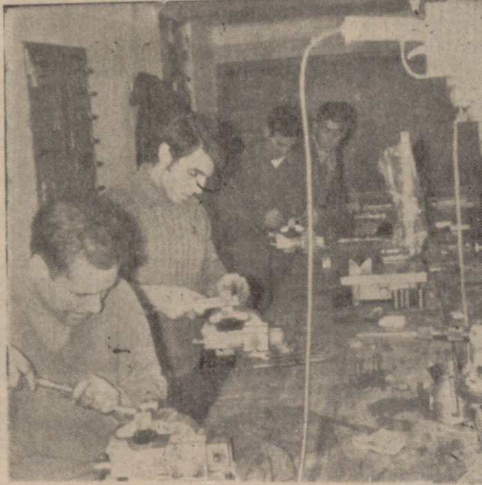
La Empresa encuentra en el Programa de Promoción Profesional Obrera la colaboración precisa para formar sus propios cuadros de especialistas. Curso de Mecánicos de Mantenimiento en la Empresa "Made", de Medina del Campo.