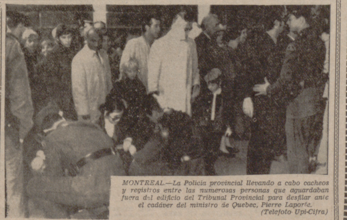
MONTREAL.—La Policía provincial llevando a cabo cacheos y registros entre las numerosas personas que aguardaban fuera del edificio del Tribunal Provincial para desfilas ante el cadáver del ministro de Quebec, Pierre Laporte.

NUEVO GOBIERNO EGIPCIO EL CAIRO. (Efe-Reuters).— Tras el nombramiento del nuevo primer ministro, Mahmoud Fauzi, el Presidente Sadat publicó un decreto presidencial en el que se forma el nuevo Gobierno egipcio.