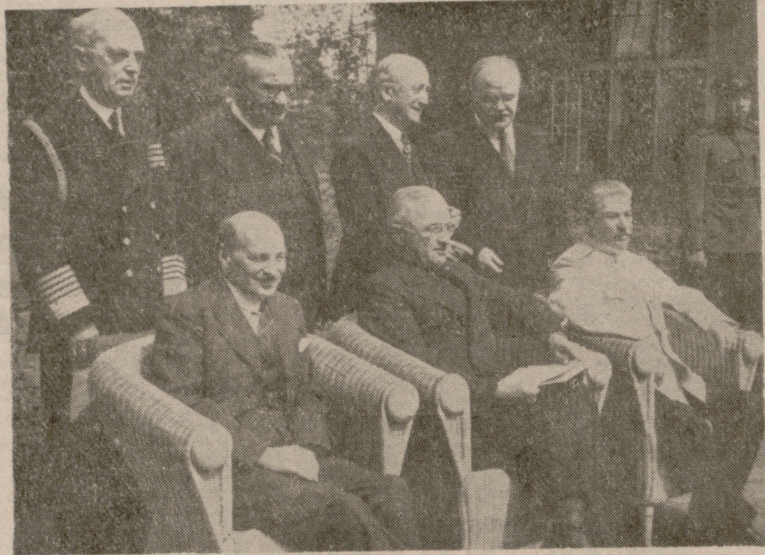
Minutos antes de la última reunión de Potsdam, posan ante los fotógrafos los protagonistas de la victoria...