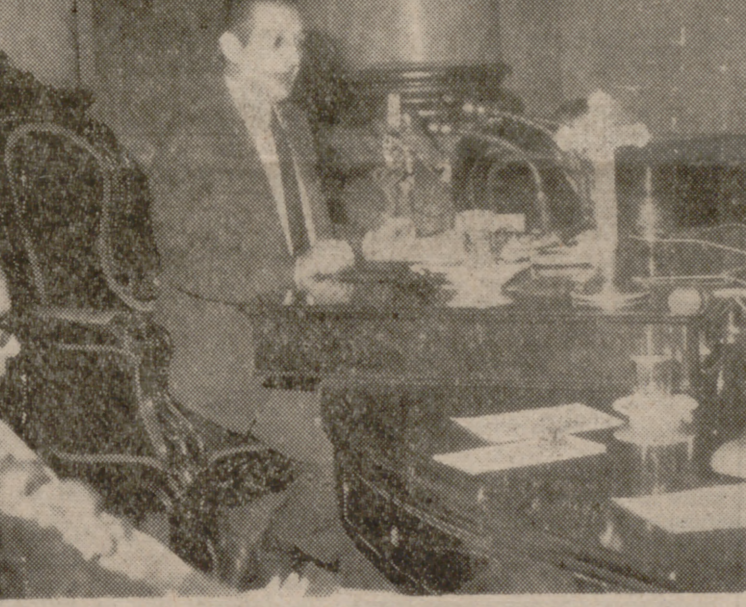
MADRID.—Se ha celebrado el Pleno del Consejo Nacional del Movimiento, bajo la presidencia del Ministro Secretario General. Se sometió al Pleno la moción relativa a la celebración del acto conmemorativo de la fundación de Falange Española en dicho Consejo Nacional el día 29 de Octubre. En la foto, intervención del Ministro Secretario General del Movimiento.—(Foto Cifra Gráfica.) (INFORMACION EN LA PAGINA SIGUIENTE)