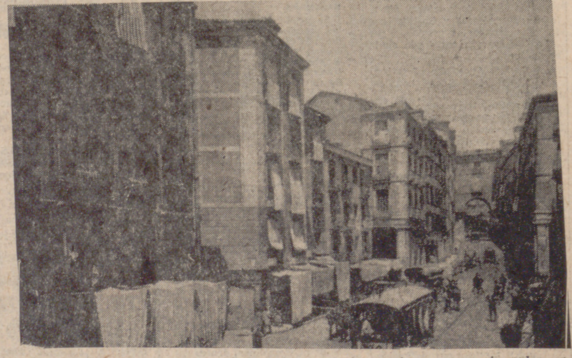
Toldos sobre la madrileña calle de Toledo en 1913: tranvías, peatones, carros de mulas... y una temperatura tórrida.

"Miserio Manzanares, no te todo el año sufrir tanta fregona, tanto lacyo y paje de valona, tan ropa servir, tanta canasta. Ahora en julio tus riberas gasta. Tanto prestado coche, tanta [dona] que lo que peca abril, julio ja [dona] califa más altiva y menos casta." (Pasa a la página sexta)