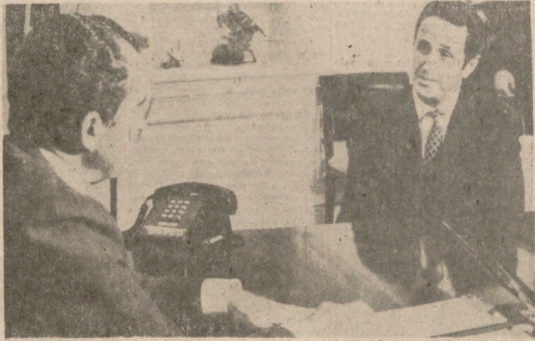
WASHINGTON. — España y Estados Unidos han firmado un acuerdo de amistad y cooperación en la capital federal. En la foto, el Ministro español de Asuntos Exteriores durante la entrevista mantenida, poco después de la firma, con el Presidente Nixon en la Casa Blanca.

Resume los deseos de bienestar social y progreso de ambos pueblos