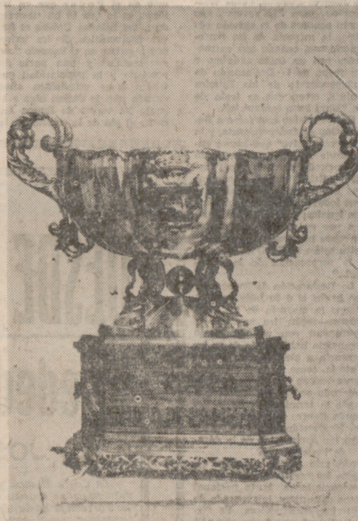
He aquí la copa, especie de "ensaladera", que el vencedor del primer trofeo "Ciudad de la Línea" se llevará a sus vitrinas. El esfuerzo merece la pena, porque está valorada en 400.000 pesetas y asegura, además, la participación del equipo vencedor en la siguiente edición.