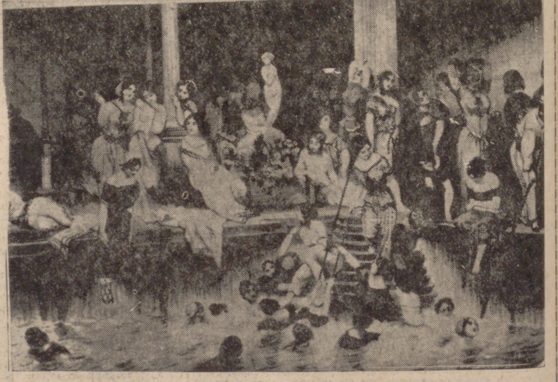
Antigua Casa de Baños, "sólo para mujeres", muy del siglo XIX.

Por lo demás, el aprendiz de río sirvió de chirimota a más de un caustico ingenio. Porque lo difícil era hallar un poco de agua en donde poder sumergirse, y en los más de los casos, el líquido elemento llegaba a los tobillos, y a lo sumo a los muslos, de aquellas bayadas y aquellos silfidos, muy cubierto de ro-