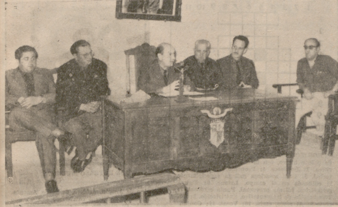
Presidencia del acto en Villagarcía de Campos