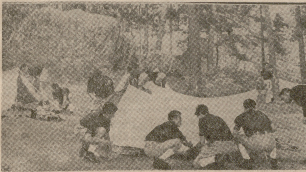
Así se instalan las tiendas del campamento.

"Vive tu aventura juvenil al aire libre", es el slogan con que abre la portada un folleto destinado a campamentos y editado por la Delegación de la Juventud de Valladolid.