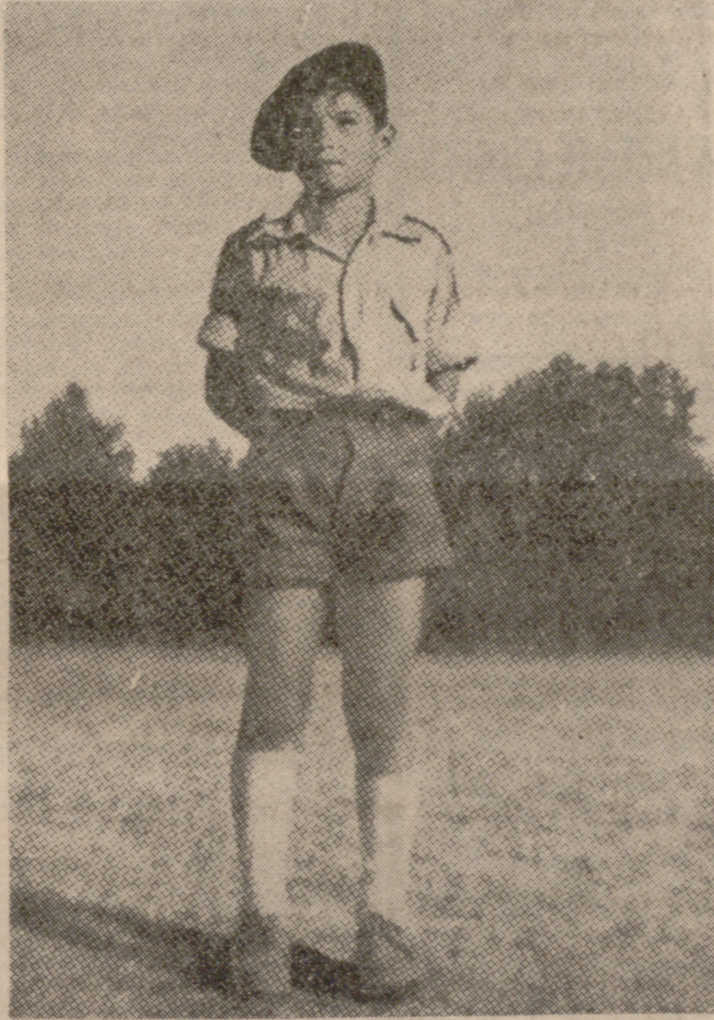
AYER: "Así me formé, viví y gocé de las maravillas de nuestros campamentos, siendo para mí de una gran satisfacción el que mis hijos sigan los pasos de su padre en la formación y en el amor a España."

en el transcurso de los distintos turnos de un campamento, se desarrollan, con una gran puntualidad y perfecto perfeccionamiento. Todas estas actividades marcan un objetivo, que no es otro que la eficacia: hacer las cosas bien, nacidas por completo y estas hay que hacerlas con garantía de permanencia. La educación político-social y cívica es una de las actividades más completas y de gran impacto formativo en el muchacho, y no dejemos en el olvido la Pedagogía ni la Educación Física, esos elementos importantísimos en el niño y en el joven. Al saltar su vida campamental sabe lo que es el orden, el respeto a la autoridad y al compañero a sí mismo. Sabe tener comprensión y se crea en su persona ese espíritu de unidad, de sacrificio y cooperación, al