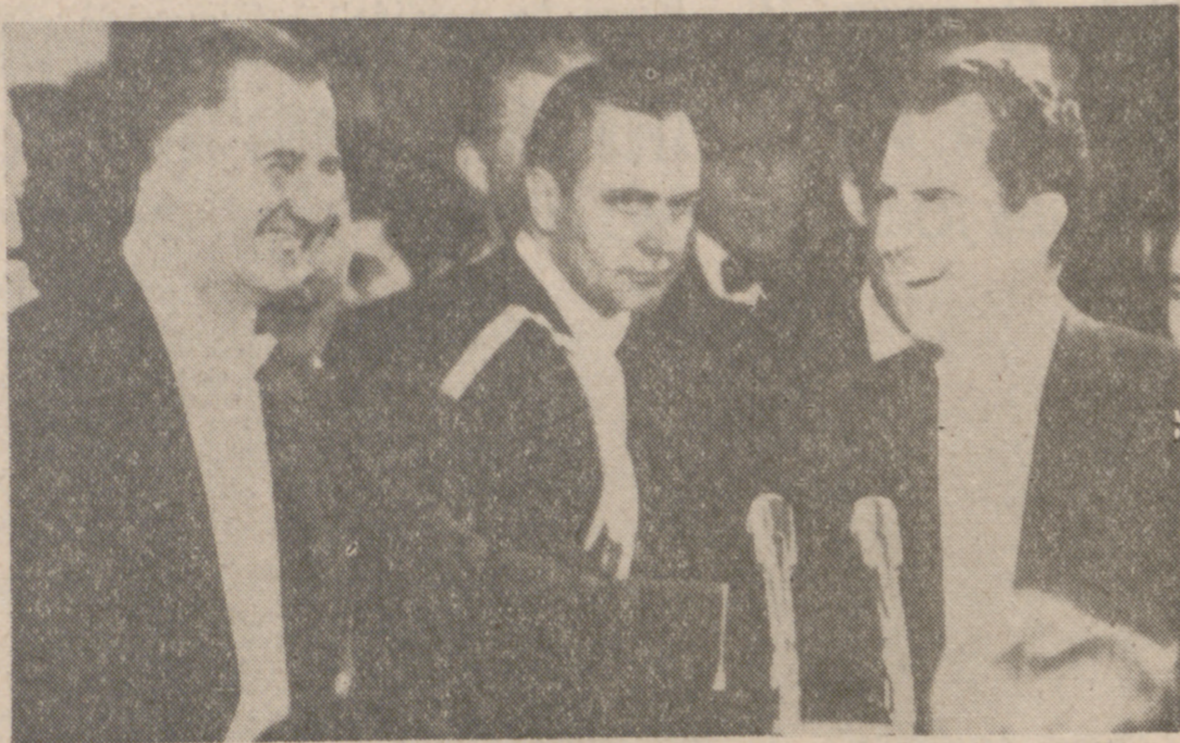
Agnew, con Nixon y otro político norteamericano.

polio de que los aguante todo el pueblo. "En este hombre hay mística", comentó Nixon, de quien se atrevía a llevar la contraria a los poderosos de Norteamérica. Ultra para unos y jacobino para otros, el Vicepresidente Agnew ha obtenido en los "Gallup" un 67 por 100 de votos favorables. Ya antes había observado un general español que la guerra que se libra militarmente cada día les soldados americanos la perdían en la Televisión a la hora de la cena.