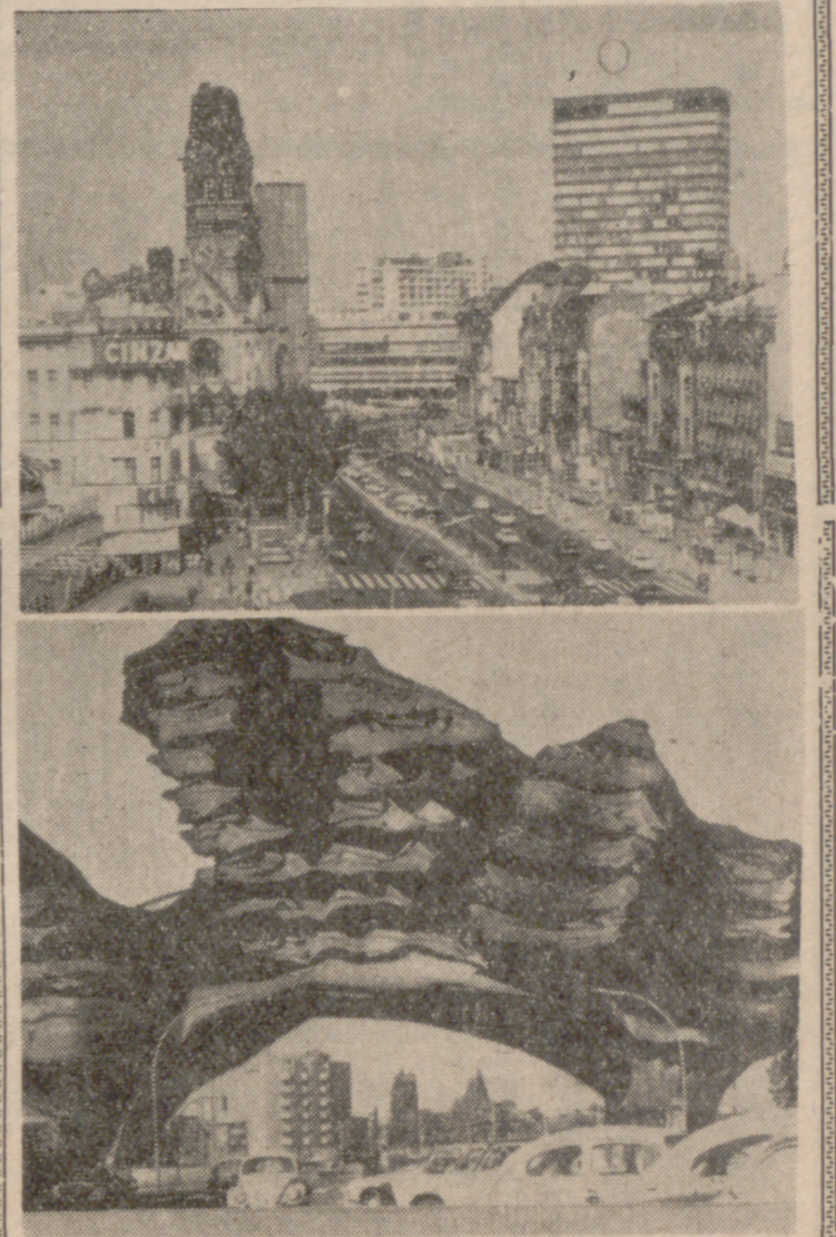
BERLIN. (DaD).—La gran avenida de Berlín occidental, el Kurfürstendamm, indudablemente seguirá siendo la más conocida entre las célebres arterias de comercios de las ciudades alemanas. Según probó una encuesta en la República Federal de Alemania, para muchos sólo esta avenida vale la pena de emprender un viaje a la antigua capital alemana. Actualmente la ciudad está haciendo una campaña de propaganda mediante atracciones culturales. Bajo el lema de "El mundo como huésped en Berlín", unas dos docenas de restaurantes del Kurfürstendamm ofrecen delicados manjares exóticos en un ambiente de estilo original.