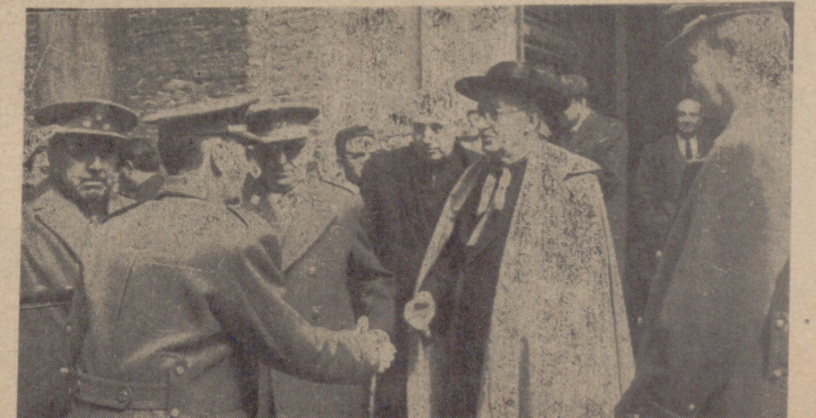
Hoy se ha conmemorado el aniversario de la Victoria con una misa oficiada en la iglesia castrense de San Felipe Neri, a la que han asistido todas las primeras autoridades. En la fotografía de Carvajal, el Capitán General es saludado a su llegada al templo. (INFORMACION EN PAGINA QUINTA)