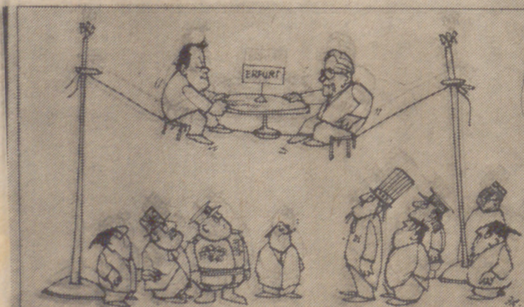
Un número no exento de riesgos.

FUNERALES DE "CORPORE INSEPULTO".—Mañana, día 2 de abril, a las once, en la iglesia de Santa Ana (habilitada de la parroquia de San Lorenzo), y acto seguido la conducción al Cementerio.