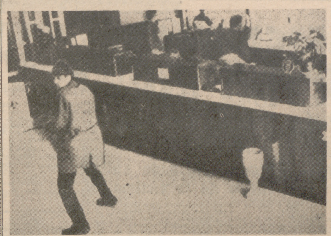
WASHINGTON.—Esta foto del F. B. I. muestra a uno de los dos hombres que, con armas automáticas, asaltaron un Banco en Nearby, Burtonsville. Los dos ladrones se llevaron un botín de más de cinco mil dólares, y huyeron en el coche de uno de los empleados del Banco.