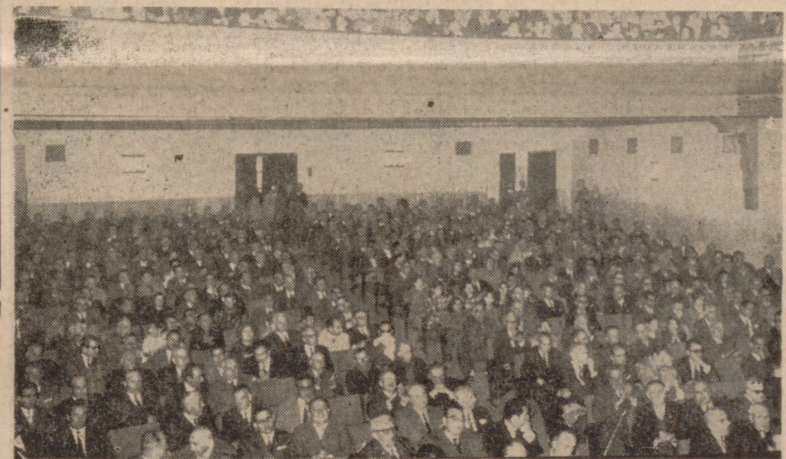
ASPECTO DEL CINE COLISEUM

El acto comenzó con la lectura del informe del director de la Caja de Ahorros de Salamanca, que se traduce en la elevación del saldo del aumento de la capacidad de ahorro de nuestros impositores. Un dato revelador de este incremento está en el hecho de que si en 1964 el saldo medio de libreta estaba en diez mil pesetas, este mismo saldo medio por cartilla en 1967 era de quince mil pesetas, y en 1969 ha llegado a cerca de veintidós mil.