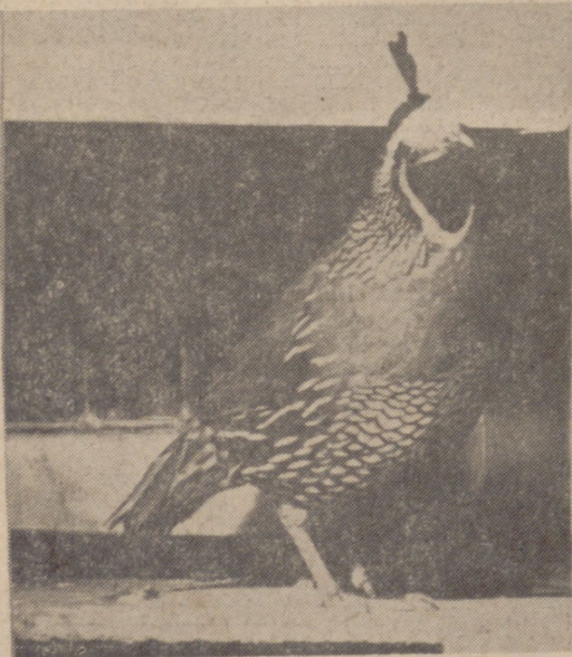
Un ejemplar de colin nacido en España.

Los ejemplares soltados hasta ahora presentan un aspecto inmejorable