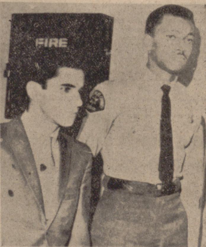
LOS ANGELES.—Sirhan B. Sirhan, custodiado por un policía del sheriff, en el momento de entrar a la sala del Tribunal para testificar en el juicio que se le sigue por el asesinato del senador Robert Kennedy.