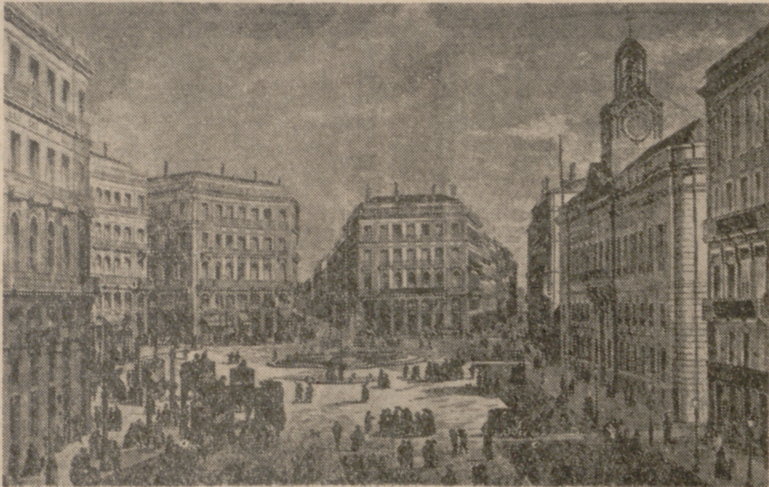
La Puerta del Sol decimonónica.

Gran tablado pintoresco.--La Puerta del Sol decimonónica.--Entrevista con don Segismundo Moret.--Una misión delicada.