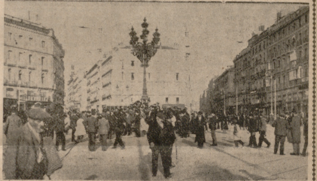
Agora, zoco, explanada... Patio de Monipodio.

honra!... ¡Todos nosotros estamos aquí para servir!... Usted es la persona para el caso, y he de añadir que con ello cabe augurarle —lo engolosino— un gran porvenir político... De ahí que el Gobierno que preside el general Prim haya pensado que nadie como usted para llevar a feliz término el delicado encargo que voy a encomendarle... Suspendió el Subsecretario su discurso, se llevó ambos pulgares a la sisas del chaleco, invitó a sentarse frente a él a su interlocutor, y tras ofrecerle un habano, se dispuso a encender el veguero, cuando don Julián, acuciado por la curiosidad, le mandó: —¿De qué se trata...? Tras unas chupadas a su habano, don Segismundo continuó: —... Materia es y muy delicada para las que se requieren de tes de probado valor, sagacidad y decisión... Por descontento que (Pasa a la página sexta)