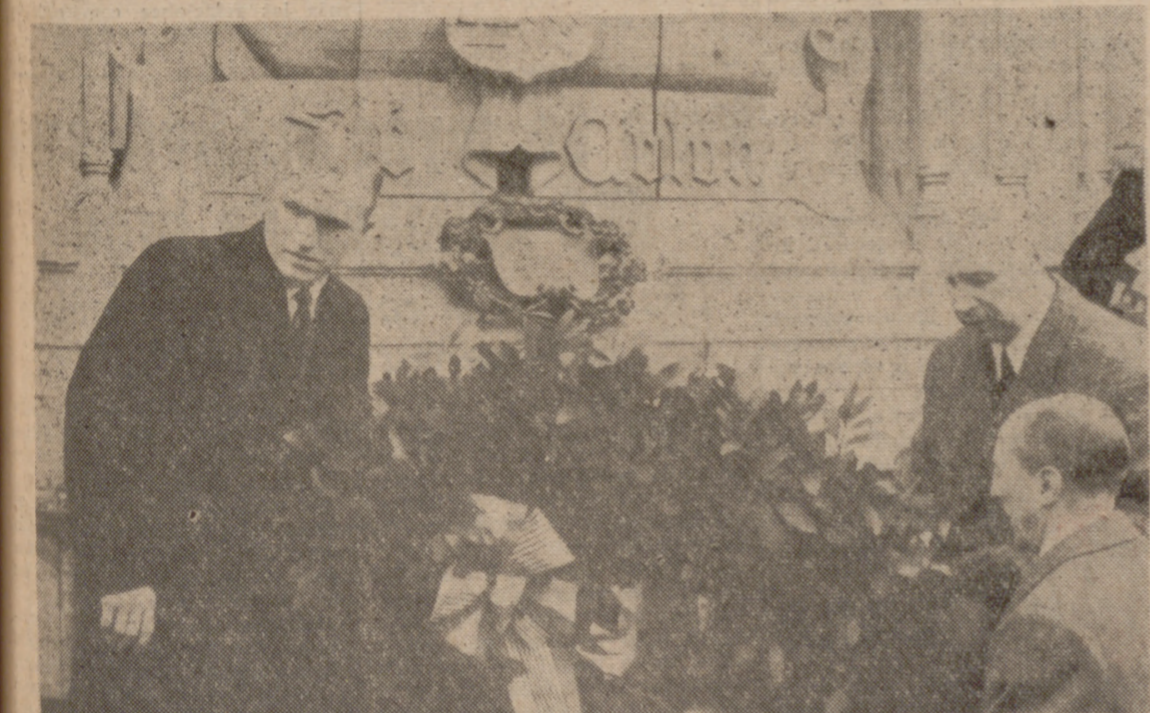
MADRID.—El famoso astronauta, comandante de la nave espacial "Apolo VIII", coronel Frank Borman, ha llegado al aeropuerto de Barajas procedente de varios países europeos en su gira ordenada por el presidente Nixon. En el mismo aeropuerto contestó a los informadores en una rueda de Prensa, celebrada inmediatamente de su llegada. Los niños fueron sus más entusiastas amigos en el recibimiento.