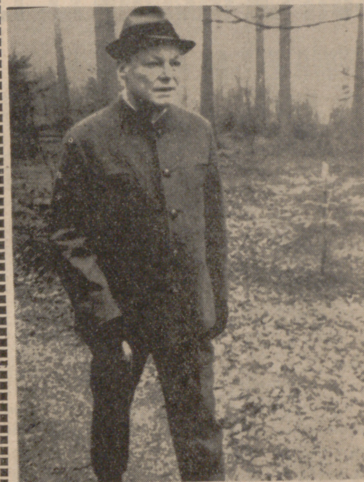
(INFORMACION EN LA PAGINA SIGUIENTE)

Tuvo una larga entrevista con el doctor Franco Nogueira