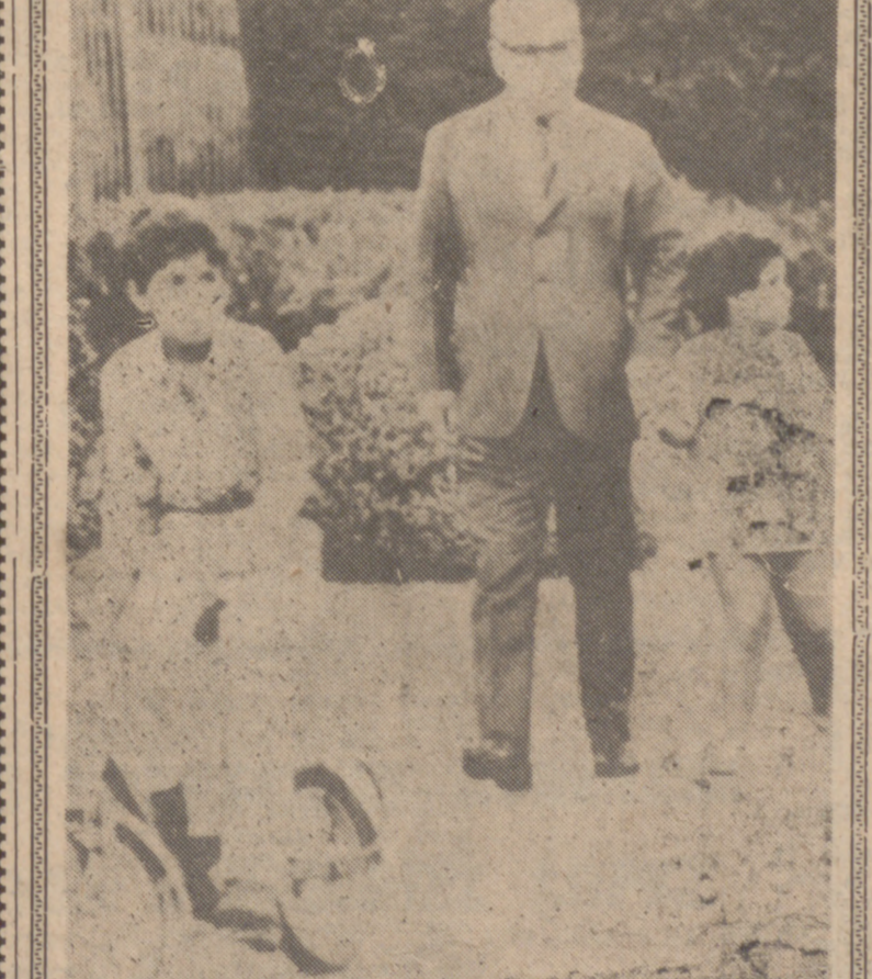
RIO DE JANEIRO.—El Presidente de Brasil, Arthur da Costa e Silva, pasea por los jardines de su residencia presidencial con dos de sus nietos, poco antes de presidir una reunión del Gabinete presidencial. El mayor de sus nietos se llama Nelson y la pequeña que da la mano a su abuelo, Carla.