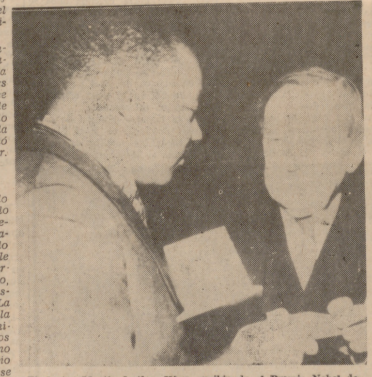
El doctor Martin Luther King, recibiendo el Premio Nobel de la Paz 1964.

dre de los tres aspectos más negativos del cine español: el folklore, el histórico y los niños. Yuri Gagarin, primer hombre que fue lanzado al espacio cósmico, cerraba, el día 27, la cuenta trágica del mes de marzo. Su muerte, que se produjo en un accidente de aviación, consternó al mundo entero, y el Gobierno de la Unión Soviética proclamó dos días de luto en su honor.