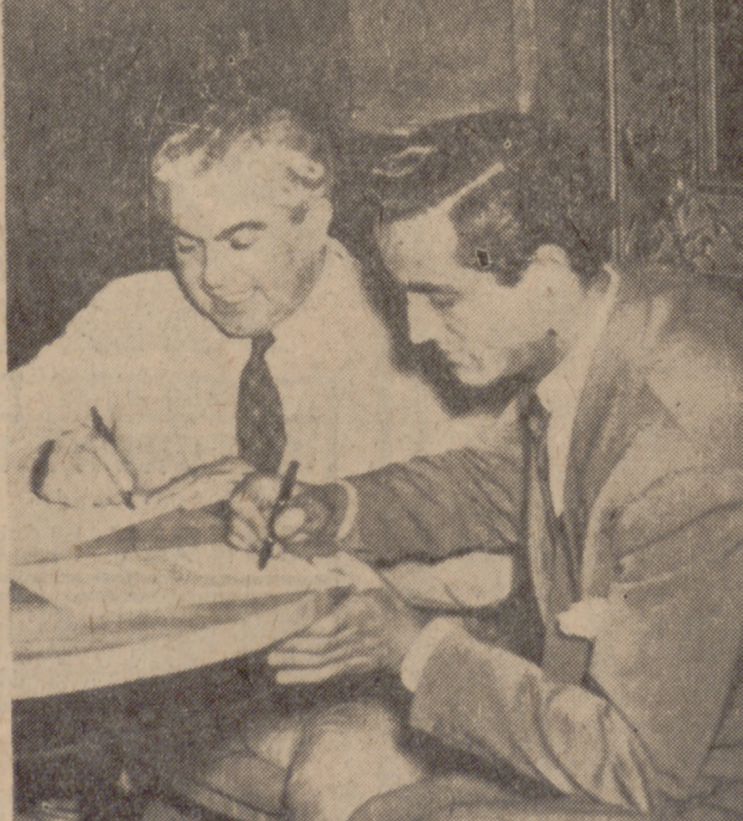
Cesáreo González ha contratado a muchos "famosos" internacionales. Aquí firma un contrato con Vittorio Gassman.

En los veintisiete años que Cesáreo González lleva entregado al cine, ha producido ciento cuarenta y seis películas. Estas cintas suponen más de cuarenta y dos millones de metros de celuloide. Habrá movido alrededor de los tres mil millones de pesetas. Sus películas las ha distribuido en más de cien países. Don Cesáreo dice: —La mitad del dinero que gano es para mis empleados. Doy dieciocho pagas extraordinarias al año. —¿Dónde estuvo su mejor mercado? —En todos los países de lengua española. Pero también he llegado a otros mercados. Hoy día las películas que llevan mi marca se distribuyen en ciento once países. —Hay quien dice que el cine que le da dinero es de infima calidad. Hasta dónde es cierta esta afirmación? —No es exacta esta definición de un cine popular. El cine popular, que llega a millones de espectadores, puede ser de buena, mala o mediana calidad. Como el cine minoritario puede ser muy bueno o muy malo. Siempre he procurado, atendiendo los amplios mercados del cine popular, ofrecer una calidad seleccionada en la mayoría de las películas. Basta repasar los nombres de directores, intérpretes, guionistas, etc., que han colaborado en Suevia, para darse cuenta de que esa apreciación de usted me hacia no es exacta. El que una producción resulte más o menos buena, más o menos comercial, no es ya una responsabilidad del productor. Lo importante es que el cineza las mejores posibilidades que crean el filme. Y, en este sentido, siempre ofrecí lo mejor.