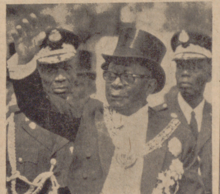
MONROVIA (Liberia).—El presidente Tubman corresponde a las aclamaciones de sus conciudadanos durante un corto paseo por la capital poco después de la ceremonia inaugural de su nuevo mandato como Presidente de Liberia.