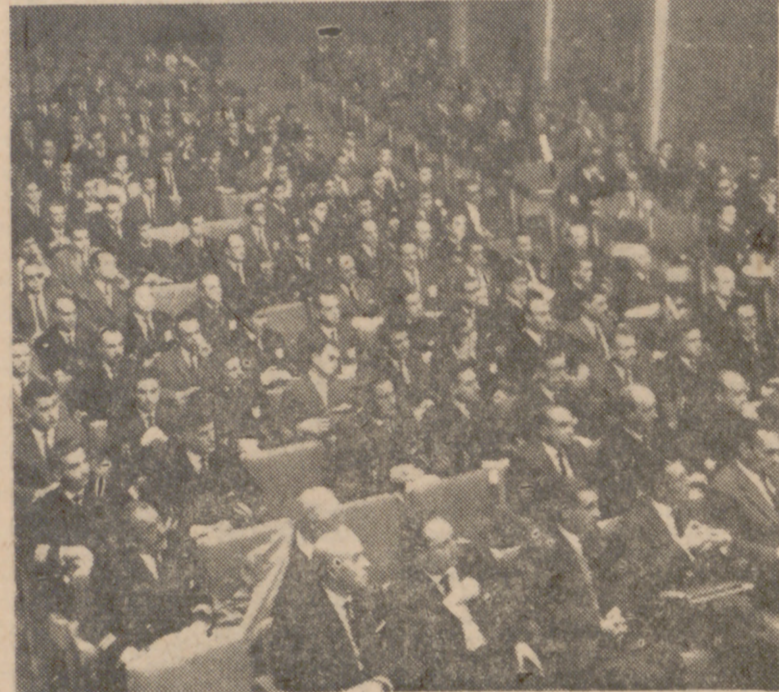
Los problemas de los marinos mercantes fueron expuestos en la I Asamblea Nacional de Oficiales (1963).

Es necesario actuarlo. En este momento hay alrededor de los cuarenta mil mil españoles navegando en mercantes con pabellón extranjero. El éxodo es cada día más frecuente, a causa de los bajos sueldos en España y de las mejores remuneraciones en otros países. Y precisamente esto incide sobre la Marina Mercante, verdadero vaso comunicante de nuestro comercio. Casi el 90 por 100 del comercio exterior con el exterior se mueve por los infinitos caminos de la mar.