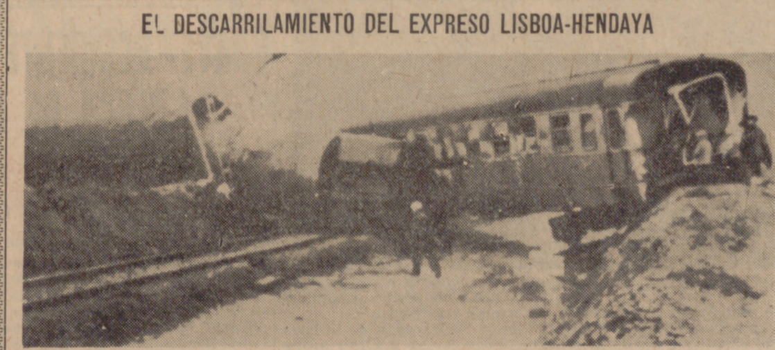
EL DESCARRILAMIENTO DEL EXPRESO LISBOA-HENDAYA