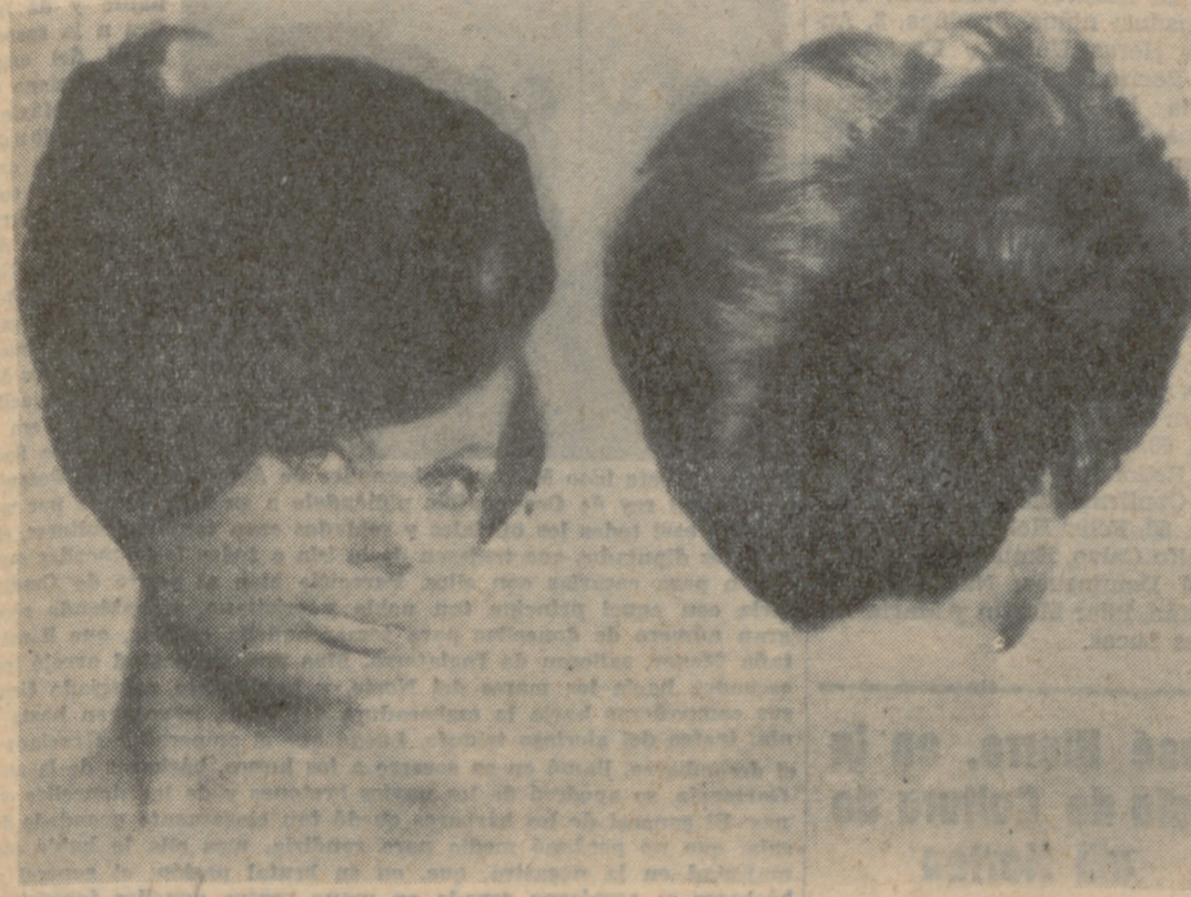
La Agrupación de Peluqueros Españoles acaba de lanzar este nuevo peinado. Le llaman «Coqueta» y en él se ha huido principalmente del cardado, estilo que ha venido siendo de uso general hasta el momento.