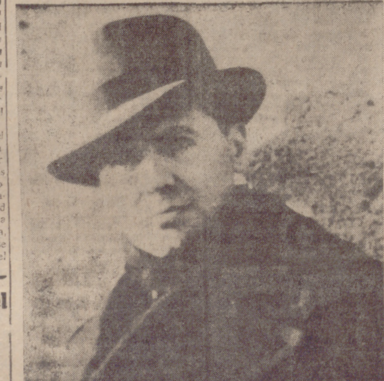
PARIS.—Fotografía de archivo de Jean Moulin, fundador del Comité de la Resistencia Nacional Francesa. Hoy han sido trasladadas sus cenizas desde el Cementerio de Père Lachaise al Panteón de París.