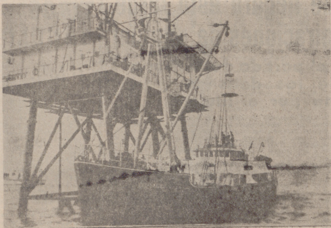
AMBERES.—La isla flotante en la cual se halla instalada la emisora de TV. que ha sido clausurada por las autoridades holandesas. Junto a la isla, el barco que transportó a las autoridades hasta la emisora pirata y un pequeño bote que transportó probablemente periodistas.