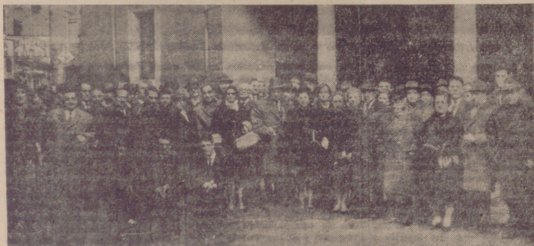
ASISTENTES A LA MISA