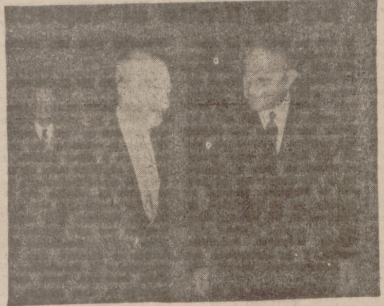
El ministro español de Asuntos Exteriores, señor Castiella, celebró una entrevista en su despacho del Palacio de Santa Cruz con el subsecretario de Estado norteamericano para Asuntos Europeos, Mr. Tyler, entrevista a la que asistió el embajador norteamericano en España, señor Woodward.