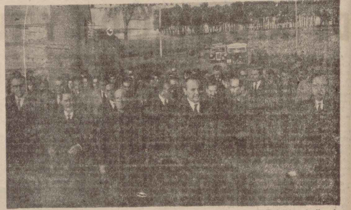
El Subsecretario de Información y Turismo con las autoridades de Valladolid, a la llegada a Almenara de Adaja.

Ayer, a las cuatro y media de la tarde, en el pueblo de Almenara de Adaja, se verificó un sencillo y emotivo acto con motivo de la inauguración de un Teleclub por el subsecretario de Información y Turismo, don Pio Cabanillas.