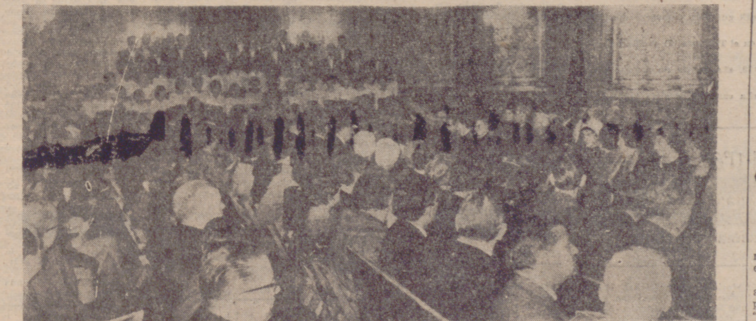
UN ASPECTO DEL SALON DE ACTOS DEL AYUNTAMIENTO DURANTE EL SOLEMNE ACTO EN EL CELEBRADO (INFORMACION EN PAGINAS INTERIORES)