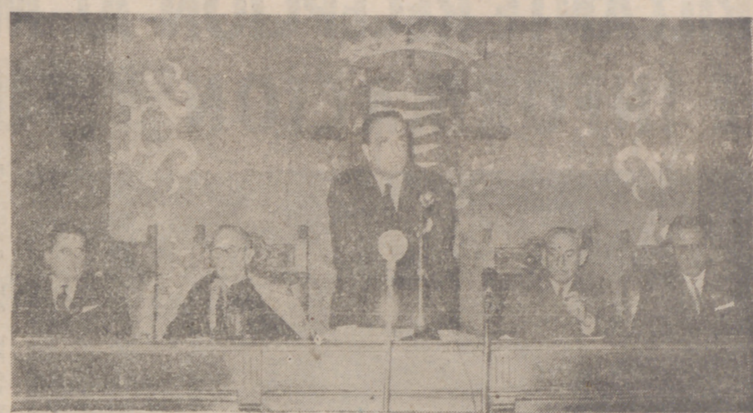
El Ministro de Información y Turismo hablando en la apertura de la Campaña Paz en la Tierra

Aparte de todo esto, tanto el Ayuntamiento dentro de la capital como la Jefatura Provincial por medio de su Departamento de Acción Política Local y la Diputación, han recorrido los pueblos de la provincia con multiplicidad de actos que han servido de información en los pueblos de la magnífica labor de los veinticinco años y de despertar los entusiasmos dormidos de nuestros habitantes que creen profundamente en el Movimiento. Tanto en aquellos que fueron viejos combatientes en los momentos heroicos como de una