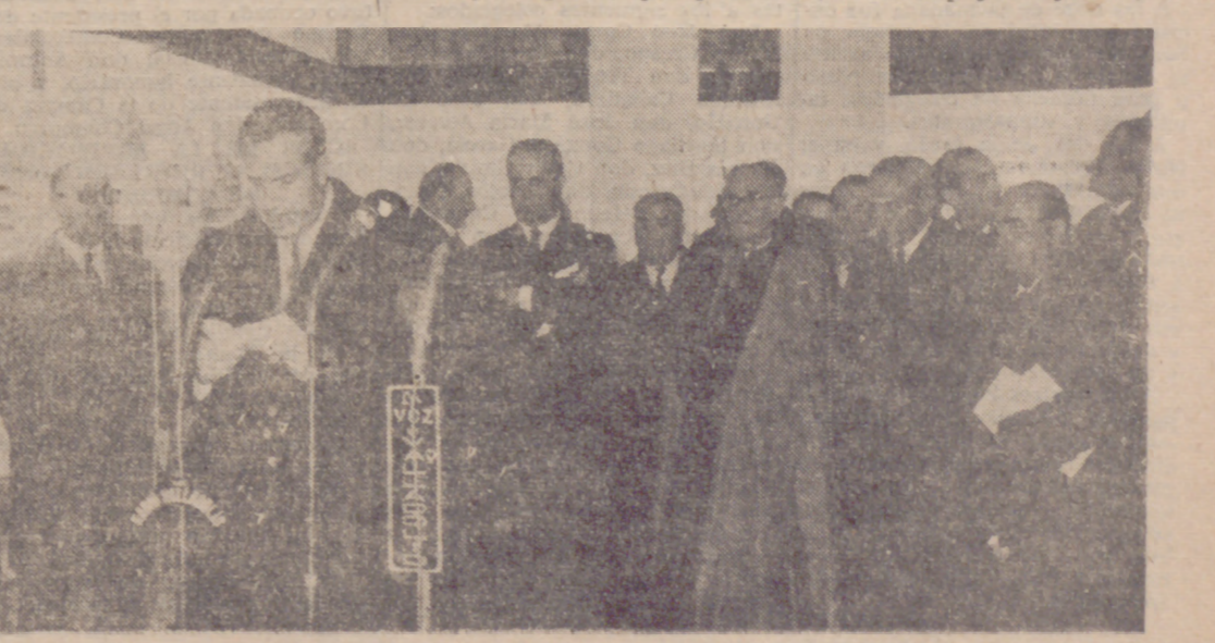
El Gobernador Civil en un momento de su intervención en los locales de la Exposición.

Felicitó duplicadamente las felicitaciones manifestadas por el Gobernador Civil por la realización de