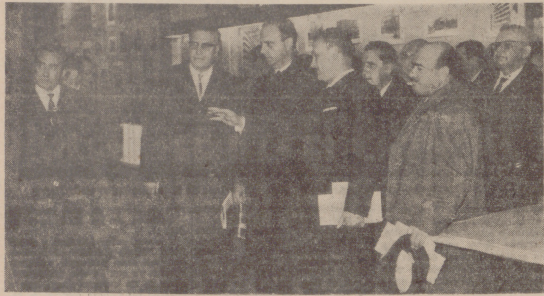
El Ministro, oyendo las explicaciones del Delegado de la Vivienda, en la Exposición.

(Viene de la página anterior) esta magna Exposición llevada a cabo, ahorrando del tiempo que exige la cotidiana labor de cada