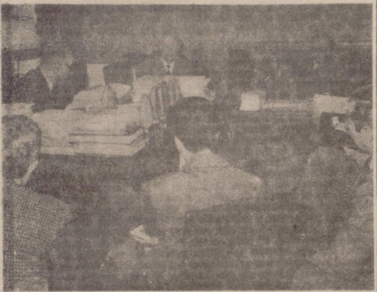
MADRID.—Don Miguel Cavero Blecua, jefe del Servicio Nacional del Trigo, durante la conferencia de Prensa sobre el precio del trigo en España en comparación con el del Mercado Común.

Servicio Nacional del Trigo vende a los fabricantes de harinas el "tipo II-2". Podemos, pues, esperar tranquilos el ingreso de España en el Mercado Común en lo que a este aspecto se refiere.—Efe.