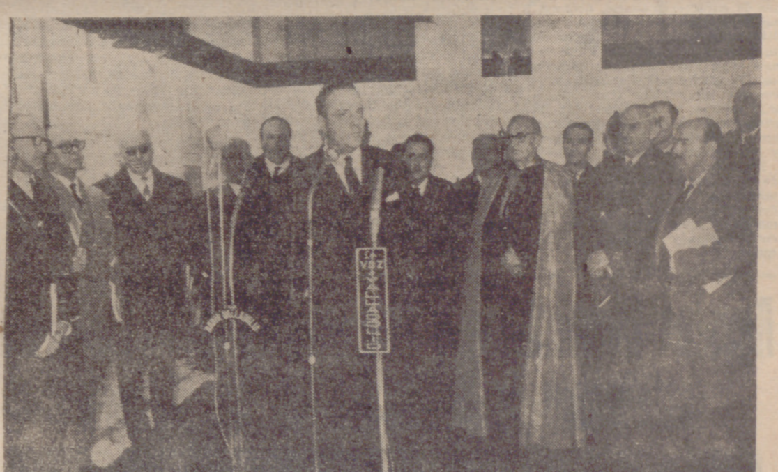
Fraga Iribarne durante su discurso en la Exposición Provincial "XXV Años de Paz".

En esta conmemoración de los XXV Años de Paz era oportuno dedicáramos parte de nuestro tiempo a presentarlos a la mirada de los españoles, que quizá no tuvieron que vagar para meditar en conjunto aquello de que los españoles hemos sido capaces y compañeros, al propio tiempo, lo que ahora hay y lo que antes no había.