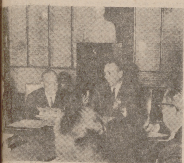
El ministro secretario general del Movimiento, José Solís, acompañado del secretario general de Sindicatos, Pedro Lastra, durante la reunión del Consejo Económico Sindical de Tierra de Campos, celebrada en la Casa Sindical.

ROMA, 19.—La sexta votación para la elección del quinto presidente de la República italiana ha dado comienzo dentro de la misma atmósfera de confusión que las anteriores.