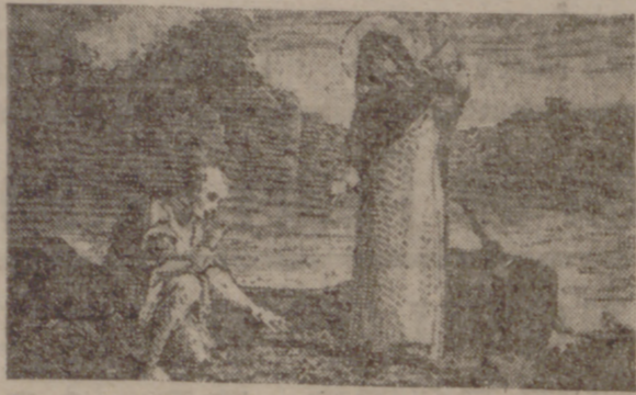
SANTO DOMINGO DE GUZMÁN, FUNDADOR (+ 1221)

Domingo de Guzmán, gloria de España y fundador de la Orden de Predicadores, nació en el obispado de Osma, en un lugar que se llama Caleruega, y fue hijo de muy ilustres padres. Estos confiaron su educación a un tío suyo, arcipreste en Gumiel de Iza, y le mandaron después a la Universidad de Palencia. Tomó en Osma el hábito de canónigo regular y por obedecer al Obispo recibió la dignidad de arcidiacono de aquella iglesia; pero al llegar a los treinta años pasó a Tolosa, donde la heresia de los albigenses hacía grandes estragos, y con sus sermones, milagros, y sobre todo, con el arma celestial del santo rosario, que le inspiró la Santísima Virgen salvó a los católicos y convirtió gran número de herejes. Después de haber predicado en la Tierra del Sol, volvió a predicar en la Tierra del Norte, y a la Tierra de la Luna. Y las longitudes de las cometas también son enormes. Algunas de ellas, como la del cometa Halley, que nuevamente nos visitará en el año 1843, media 220 millones de kilómetros; es decir, más del doble de la distancia que separa a la Tierra del Sol. Esperamos ahora el paso del Encke, al que más valdora damos las intenciones que sobre él tienen los científicos norteamericanos, estudiando en la Tierra, como galán en los espacios planetarios que giran alrededor del Sol en órbitas muy alargadas y que por lo menos han sido vistos dos veces, y otros cometas de órbita hiperbólica.