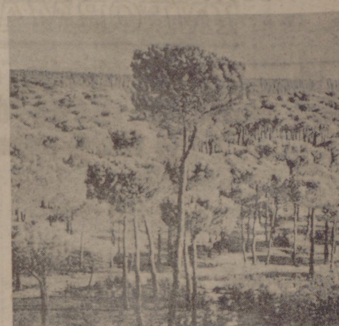
El pino piñonero, el de los piñones comestibles, es común en Castilla, y sobre todo en nuestra provincia.

Es de un gran interés para la nación la conservación de sus montes, legados como preciosa reliquia de la naturaleza. En España, actuando y gracias al Servicio de Defensa de los Montes contra Incendios, empezamos a preocuparnos por evitar en lo posible incendios, enemigos emérgicos de los montes. Pero es preciso que todos colaboremos y prestemos nuestro apoyo para que, efectivamente, el número de siniestros disminuya. Escar siempre preocupados de no provocar, por descuido, un incendio cuando vamos al campo, evitando en lo posible encender cerillas; tirar, sin haber apagado convenientemente,