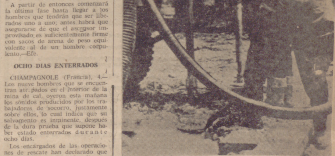
CHAMPAGNOLE (Francia).—Prosigue activamente el trabajo de salvamento de los mineros sepultados. En la "foto", una taladradora en acción.

OCHO DIAS ENTERRADOS. CHAMPAGNOLE (Francia), 4.—Los nueve mineros que se encuentran atrapados en el interior de la mina de cal, oyeron esta mañana los sonidos producidos por los trabajadores de socorro, justamente sobre ellos, lo cual indica que su salvamento es imminente, después de la dura prueba que supone haber estado enterrados durante ocho días. Los encargados de las operaciones de rescate han declarado que esperan que el primer hombre suba a la superficie en la cápsula de salvamento hacia el mediodía o poco después. La perforadora que realiza el taladro se detuvo esta madrugada a unos cuatro metros del lugar en que se encuentran los mineros, sobre el techo de la galería en la que han estado durante plazos angustiosos y llenos de incertidumbres. Los equipos de socorro han cubierto la apertura realizada con secciones tubulares de acero, una junto a otra. Al alcanzar la distancia indica-