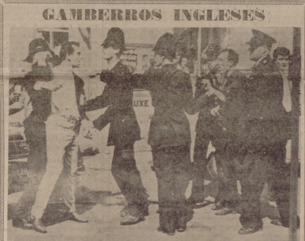
HASTINGS (Sussex).—La Policía detiene a uno de los participantes en los disturbios registrados durante el fin de semana de la fiesta bancaria. La detención se realiza ante la puerta de un establecimiento de diversiones. Los "Mods" y los "Rockers" iniciaron grandes luchas, pero fueron parados por la Policía.

Mañana, asamblea de avicultores en la Casa Sindical Habrá coloquio con los asistentes. Mañana, a las once, se celebrará en la Casavinciales, coloquio con los asambleístas, llamada "indical "Onesimo Redondo" la asamblea de la afiliación a la U. S. E. A. y designa-avicultores, en la que se tratará de la constitución de la Comisión Delegada Provincial y jefe ción de la Unión Sindical de Empresarios Avi-Ge la misma. colas (U. S. E. A.); lectura de sus Estatutos pro-