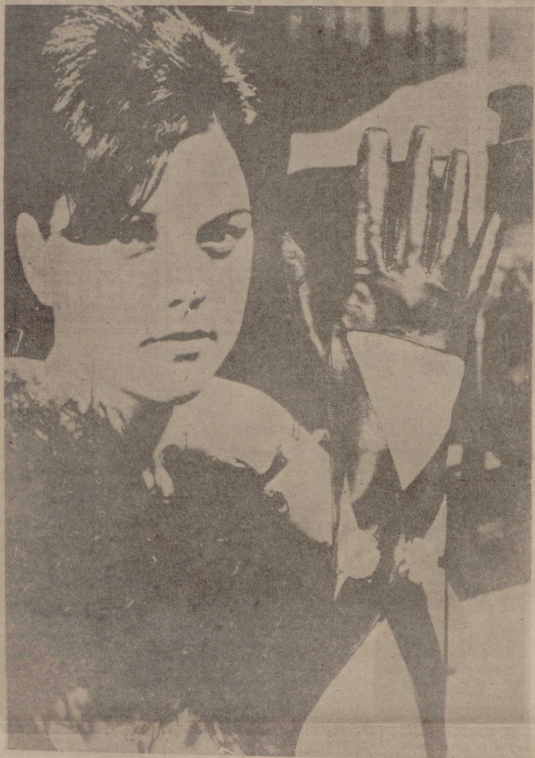
Igual que los trajes de baño se han quitado una pieza, los guantes han decidido quitarse tela. Es decir, en este caso, piel. La muchacha, con aire de conspiradora del XIX, adornada con un boá de plumas negras, nos enseña la nueva merma que la moda impone.