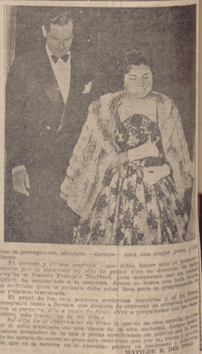
que la protagonista absoluta — Soraya — será una mujer joven y elegante.

GINEBRA.—Entre los organismos de las Naciones Unidas que en Ginebra tienen su sede central, figura la Organización Mundial de la Salud (OMS), que es, sin duda, una de las pocas entidades internacionales realmente benéficas y admirables por su labor humanitaria, entre tantas y tantas otras de tan discutible utilidad como profusa nomenclatura. Enrentada con problemas sanitarios y sociales de primera magnitud, la OMS ha emprendido ahora un estudio profuso y exhaustivo sobre ese universal y aterrador fenómeno del éxodo rural; ese movimiento de amplitud sin precedentes que es hoy en el mundo entero la incontestable migración hacia las ciudades de las poblaciones rurales de todos los países, y que puede alcanzar proporciones catastróficas en los próximos diez o veinte años. En las grandes urbes tentaculares de las naciones industrializadas se ha llegado ya al tope de alarma: la concentración de masas humanas, de viviendas, de fábricas, de vehículos, etcétera, señala con mayor nitidez cada día el peligro de la saturación.