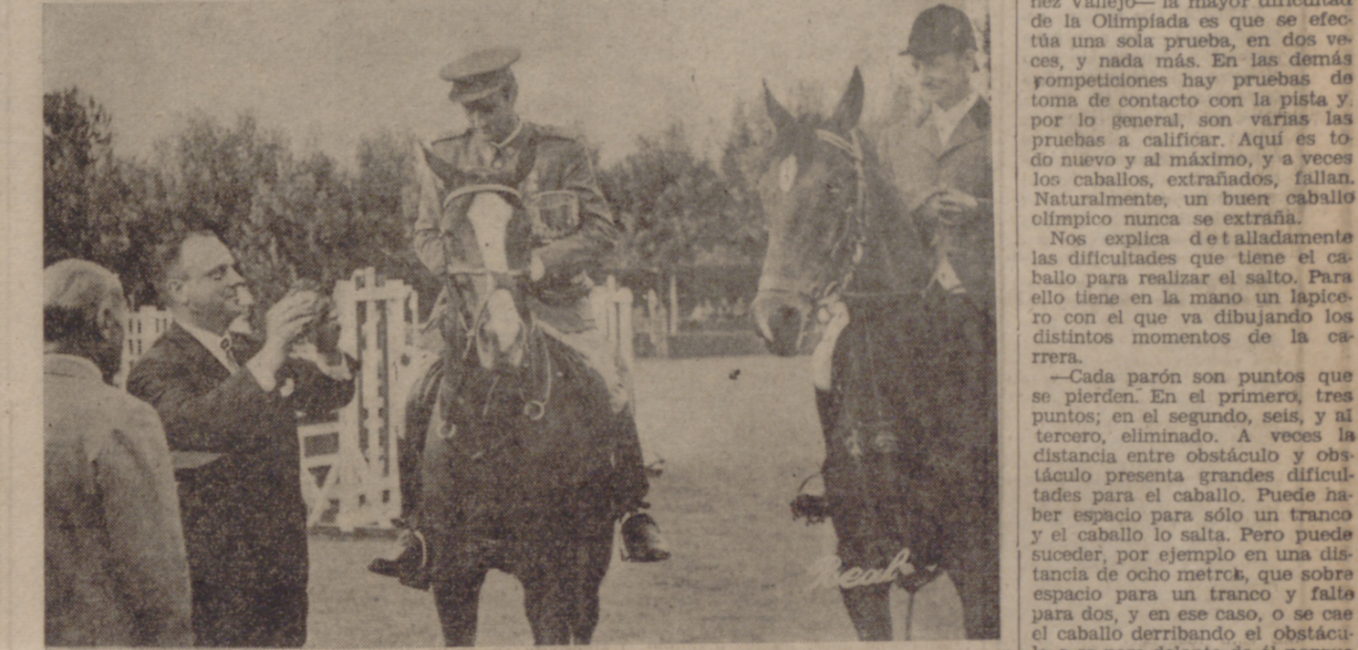
En Burgos gana cinco pruebas, de seis, incluido el Gran Premio de Burgos.

1962: Sufre un accidente en marzo, con rotura de cabeza de fémur y pelvis, quedando inutilizado siete u ocho meses.