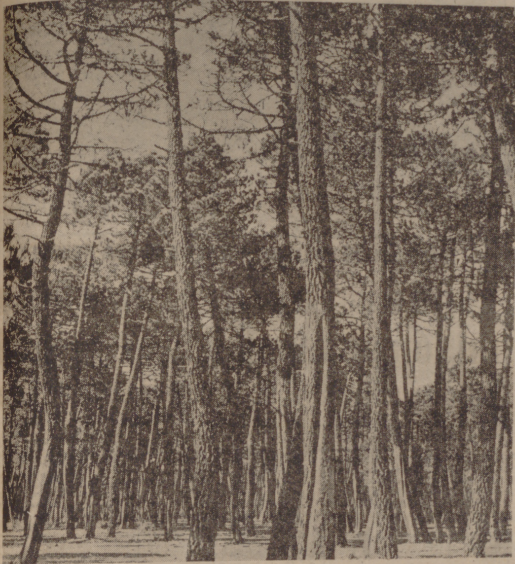
El más común del género en España es el pino pinaster (negral, rodano, etc., según las regiones), y su aprovechamiento más característico, la resina.

Una amplia red de vigilancia se está montando en todos los montes de España. En los lugares más vulnerables se están colocando observadores en unas torres de gran altura, desde donde se domina una gran extensión de monte. Estos observadores, equipados con radiotelefonos, cada dos horas se ponen en contacto con una emisora central. La primera emisora se instaló en la provincia de Pontevedra en el año 1957. Actualmente hay aparatos instalados, en número de trescientos, en las provincias de Lugo, Orense, La Coruña, Pontevedra, Valencia, Tarragona, Murcia, Gerona, Toledo, Cuenca, Soria, Baleares, Sevilla, Huelva y Ciudad Real. En fecha próxima se esperan instalar quinientos más, con lo que se cubrirán las necesidades de toda España.