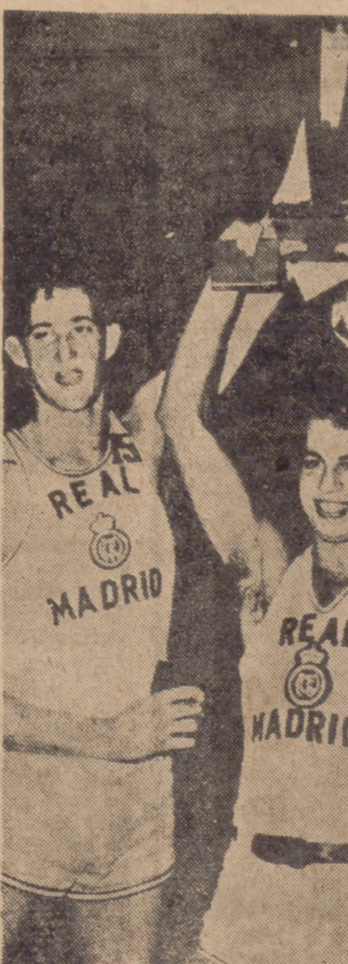
El equipo de baloncesto del Real Madrid ha ganado el Torneo Internacional de París por segunda vez después de ganar al Alcega de Bayona por 31-1. Burgess, Sevillano y Luyk sostienen en alto la copa de la victoria.