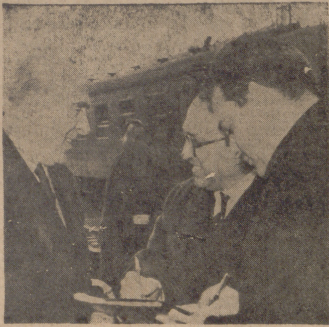
MADRID.—Por retocarla y procedente de Roma, ha llegado a la capital de España don Santiago Aldunate, embajador de Chile en la Santa Sede. Para recibirlo, en la Estación del Norte, acudieron el embajador de su país en Madrid y alto personal del Ministerio de Asuntos Exteriores.