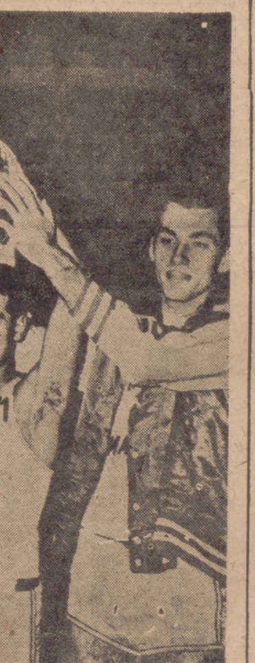
El equipo de baloncesto del Real Madrid ha ganado el Torneo Internacional de París por segunda vez después de ganar al Alcega de Bayona por 31-1. Burgess, Sevillano y Luyk sostienen en alto la copa de la victoria.