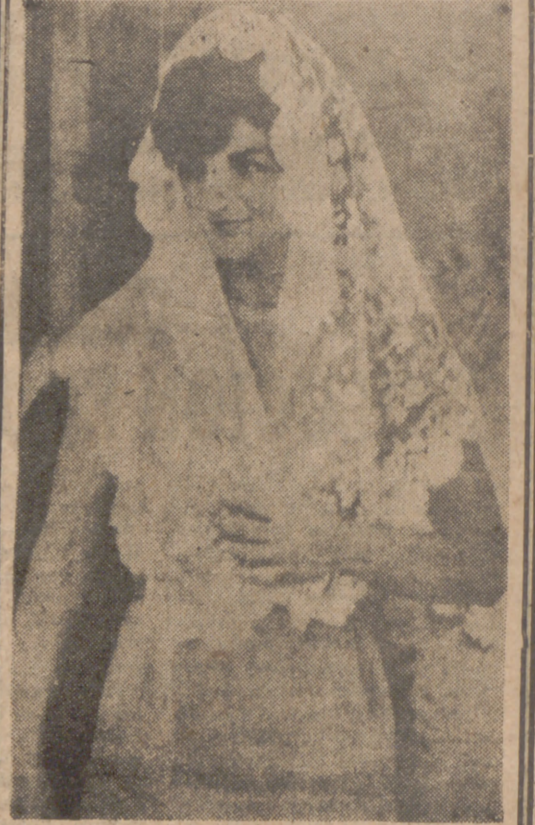
Jacqueline Kennedy luce una mantilla blanca a la salida de la iglesia de San Eduardo, en Palm Beach, donde asistió con su esposo a la misa de Navidad el pasado día 25. La señora Kennedy eligió la mantilla blanca.