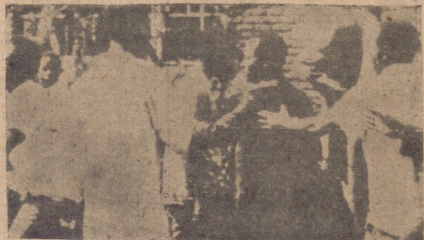
NAIROBI (Kenia).—Partidarios de facciones rivales del partido de la Unión Nacional Africana de Kenia (K.A.N.U.), que dirige Jomo Kenyatta, durante la refriega que mantuvieron entre ellos en una manifestación política celebrada en esta capital. La Policía, para dispersar a los revoltosos, debió emplear bombas lacrimógenas.