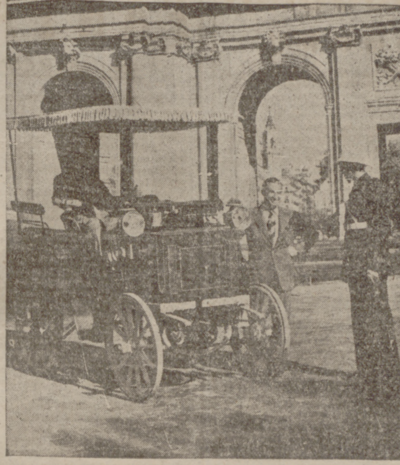
MADRID.—Este es el coche «Panhard Pevassors» del año 1895, perteneciente a la Sección Histórica del Real Automóvil Club de España, que tomará parte en la tradicional carrera de coches históricos que se celebrará el 4 de noviembre en Inglaterra para conmemorar el «Día de la Emancipación» automovilista en Gran Bretaña. Son 61 años de vida y en rodaje todavía.