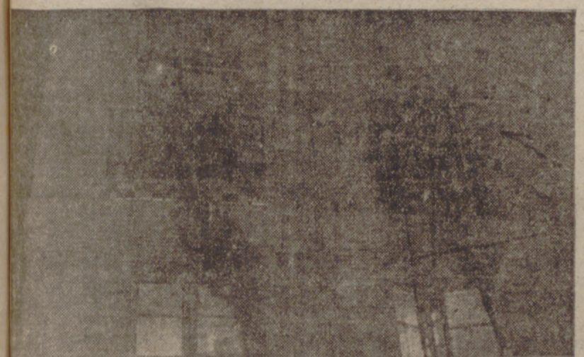
Aspecto de la fachada de la casa número 10 de la calle de Menéndez Pelayo durante los trabajos de extinción realizados por los bomberos.

Ardió una habitación de una academia de corte