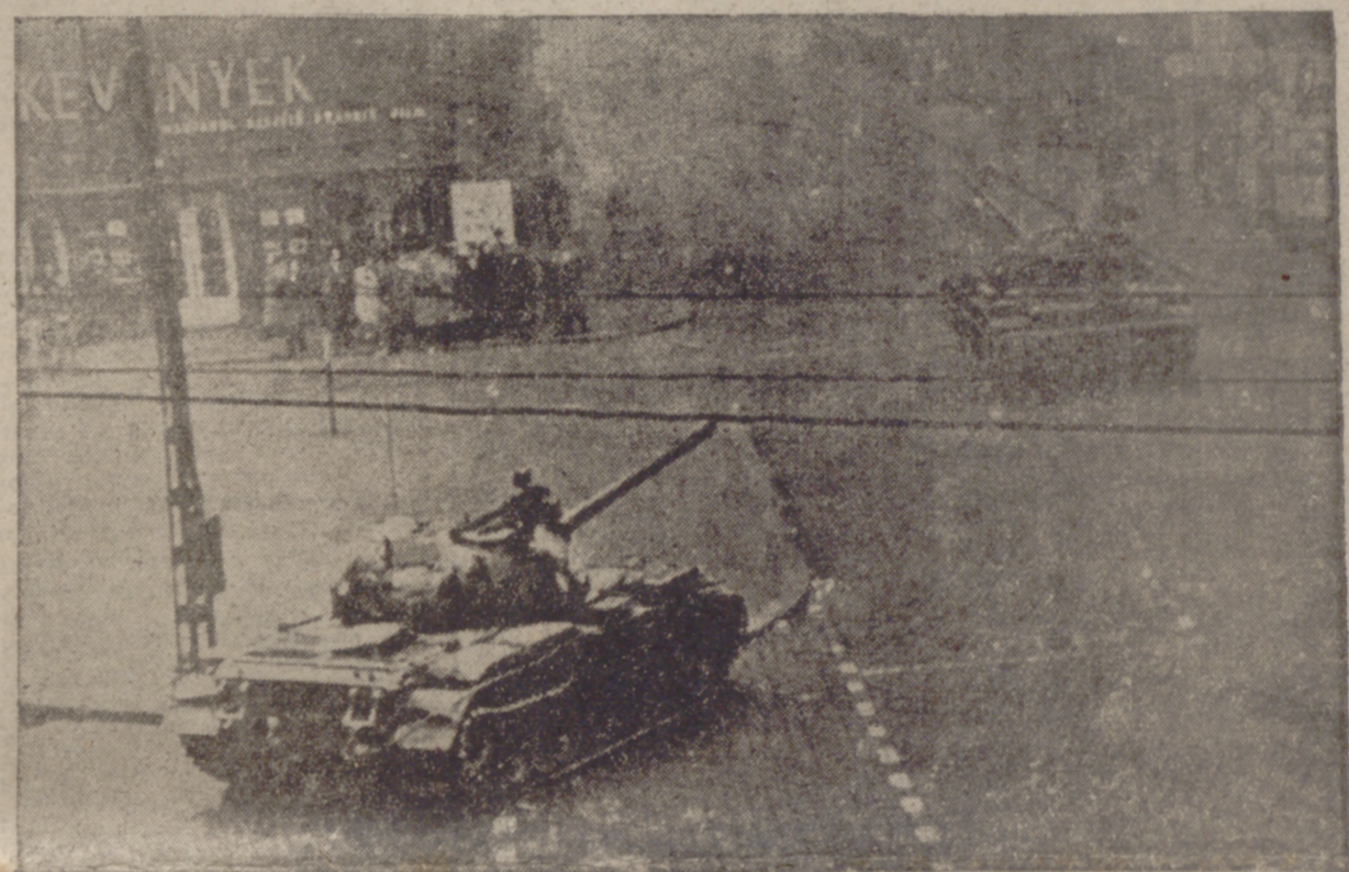
Tanques rusos disparan sobre la población inerme de Budapest.

Para unirse a las tropas rojas que luchan contra los patriotas SE HA REANUDADO LA LUCHA EN BUDAPEST