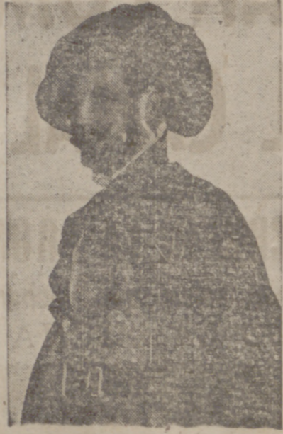
drama gustará por lo bien verificado.

Se ha hablado mucho de cómo fue tratada la obra de Zorrilla, "Don Juan Tenorio", en el día de su estreno, habiéndose generalizado la opinión de que Zorrilla fue duramente criticado con esta obra. Lo cierto es que la crítica de los días siguientes al estreno de "Don Juan" es elogiosa para el drama y el poeta, con la excepción de algunos periódicos y revistas que analizan la obra en relación con el dogma y que encuentran que éste no sale bien librado de las manos de Zorrilla.