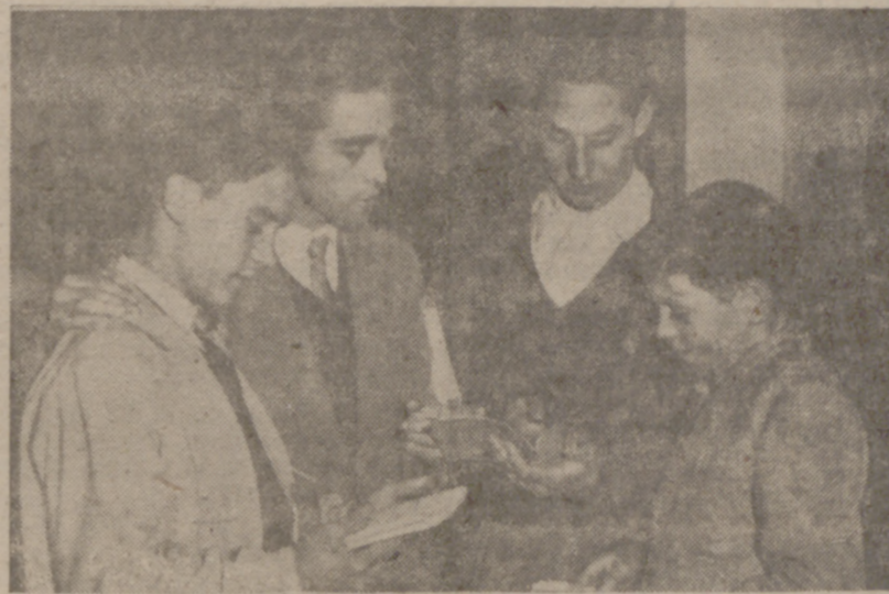
Faltan pocos minutos para el último repaso para la lección del día.

Cerca de nueve mil alumnos han desfilado por ellos, desde el año 1912