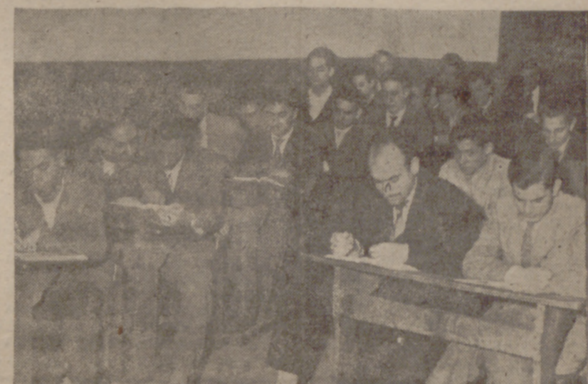
Una de las clases de mayor interés para los alumnos, dependientes de comercio, es la de idioma francés, concurridísima todas las noches.

Para penetrar en las interioridades de estos cursos nos trasladamos anoche al mencionado grupo