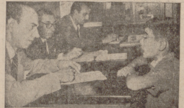
El Tribunal constituido por catedráticos de Instituto, presidido por miembros del mutualismo laboral, sigue atentamente las respuestas de este pequeño, presentado a examen para su ingreso en una Universidad Laboral.

Casi sin darle importancia, el Movimiento nacional está percibiendo en los oídos no de los hombres españoles actuales, sino en los de los que más tarde lleguen. La obra, por tanto, es una obra gigantesca y a largo plazo, quizá no mucho, pero sí lo necesario para que pueda advertirse a grandeza de la tarea. Hemos empleado los términos de grandeza y grandeza, y nos alegra no vernos forzados a