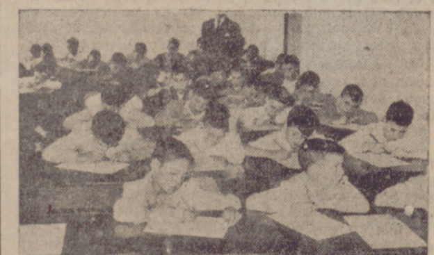
Niños de diez a doce años presentados para el examen de ingreso en la Universidad Laboral de Córdoba haciendo su ejercicio de dictado, vigilados por los profesores.

El número de alumnos aprobados por Universidad Laboral, es ahora sólo el treinta por ciento de su futura capacidad normal, habiendo ingresado quinientos cincuenta entre los diez y doce años, y quinientos veinte entre los catorce y dieciséis, para el primero y segundo cursos en calidad de internos, y como externos, doscientos cincuenta y seiscientos cincuenta para ambos cursos, respectivamente. Conviene decir a los padres de los alumnos que no han ingresado ahora, y a éstos mismos, que no tienen razón para el desánimo, porque en el mes de agosto del año próximo