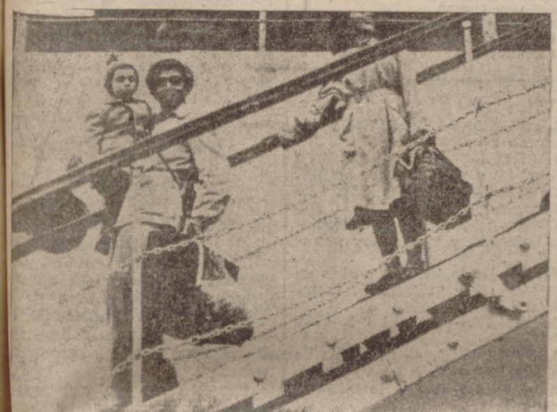
Los repatriados muestran su contento al desembarcar en el puerto de Valencia.