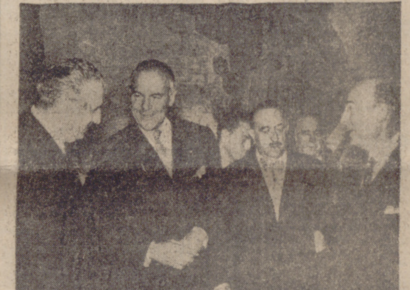
Un momento del acto de la firma de un nuevo acuerdo sobre venta de excedentes agrícolas entre España y los Estados Unidos. Firmaron en nombre del Gobierno español el ministro de Asuntos Exteriores, señor Martín Artajo, y en el de los Estados Unidos, su embajador, señor John D. Lodge.

Madrid, 23.—La Oficina de Información Diplomática del Ministerio de Asuntos Exteriores ha comunicado a la Prensa la siguiente nota: