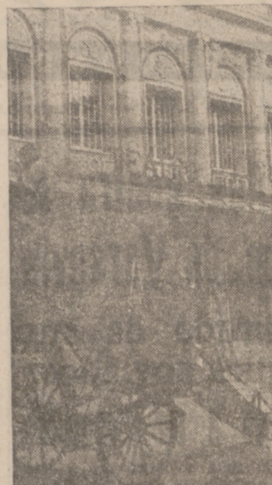
inaugural y en la que la tantas veces centenaria zarzuela "Doña Francisquita" vivirá una nueva etapa con un reparto como nunca pueden haber soñado los seguidores de la zarzuela española.

El patio de butacas ha ganado mucho en amplitud, ya que ha sido suprimida una platea de cada lado, aunque sigue perfectamente definida su línea de herradura. Nuevas y amplias butacas de color crema claro y tapizado rojo, un gran telón de boca. El techo, bien decorado, con una araña en el centro en torno a la cual se multiplican círculos de luz... Airosas barandillas blancas señalan la se-