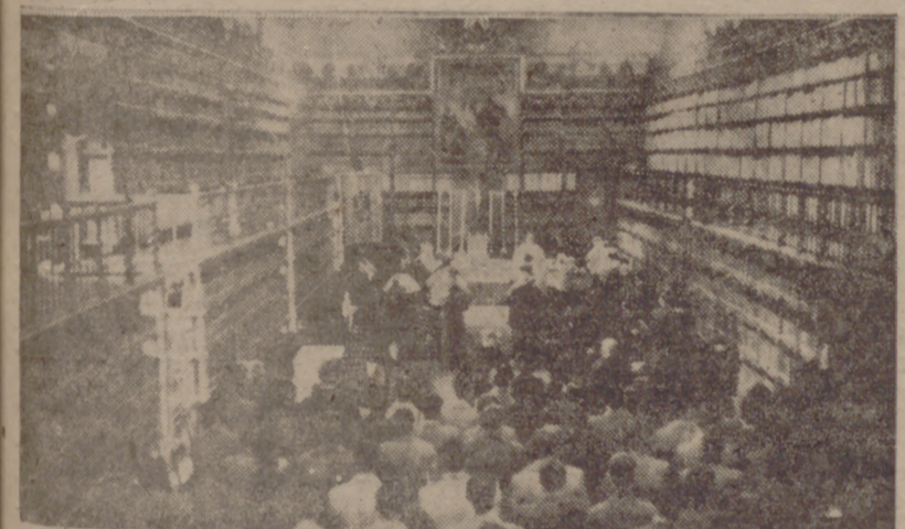
Jardines de sus familias durante los años de carrera, están ejerciendo. PROCEDENCIA DE LOS ESTUDIANTES

El Distrito Universitario de Valladolid es el más amplio de todos los de España. Comprende, con la de su cabeza, las provincias vascongadas, Palencia, Burgos y Santander. Sete provincias. De ellas es el fondo principal de las procedencias de jóvenes estudiantes de carreras universitarias, pero no es rara la presencia de alumnos de Galicia, de Andalucía y de algunas otras regiones, Asturias y León principalmente, y asimismo se registran contingentes notables de los países de Hispanoamérica. Concretamente, en la Facultad de Medicina, han cursado durante los pasados años varios alumnos de la China, dos de ellos sacerdotes jóvenes que se preparaban para hacer más eficiente su labor de apostolado en la patria, mediante el complemento del ejercicio de la medicina. Durante los años que precedieron a la Cruzada fueron muchos los hijos de labradores que, sin ánimo de ejercer en el porvenir la carrera, estudiaban Derecho en Valladolid. La razón de elegir estos estudios—decían—es adquirir unos conocimientos culturales que les valiesen para seguir desde sus pueblos la marcha general de la política del país. Se hacían la ilusión, al parecer, de que habiendo seguido la carrera de Leyes se colocaban en situación conveniente para poder interpretar en las jornadas diarias desde las tertulias en rebóticas o casinos de pueblo las discusiones parlamentarias de que tanta literatura acarreamos los periódicos, y esto, se figuraban ellos, daba tono y adornaba el rango recientemente de personalidad