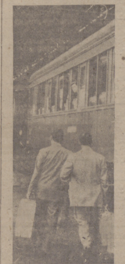
El viajero que sale de la Estación se encuentra con un pavimento africano, que desentona fuertemente con los otros motivos ornamentales que aparecen a la entrada de la ciudad. Ahora, por fin, se va a ventilar este problema urbano con las obras de pavimentación a que se hace referencia en este reportaje

Isidro Polo, San Benito, San Ignacio, Fabionelli, plaza de las Brigadas, Imperial, plaza de San Nicolás, General Queipo de Llano, Delicias, Córdoba, Hermanitas de la Cruz, Vegarria, Canarias, Argales, Tranque, Villanueva, Santamarina, paseo de San Vicente, acceso al Pinar de Antequera, Mota (La Rubia) y un pequeño tramo de García Morato.