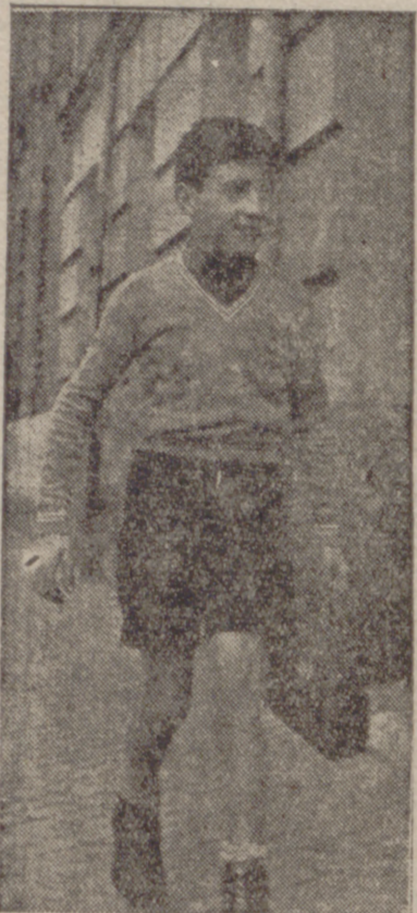
deber, a su manera; una manera original que tiene una eficaz virtud y una ejemplaridad evidente.

Por eso precisamente ahora, cuando llega el otoño, sentimos en el corazón el dulce peso de la escuela. Gracias a un maestro, para vivir no hemos tenido que abandonar del todo la integridad de la infancia. Y si eso es verdad, nuestra escuela, la escuela española, ha cumplido con su