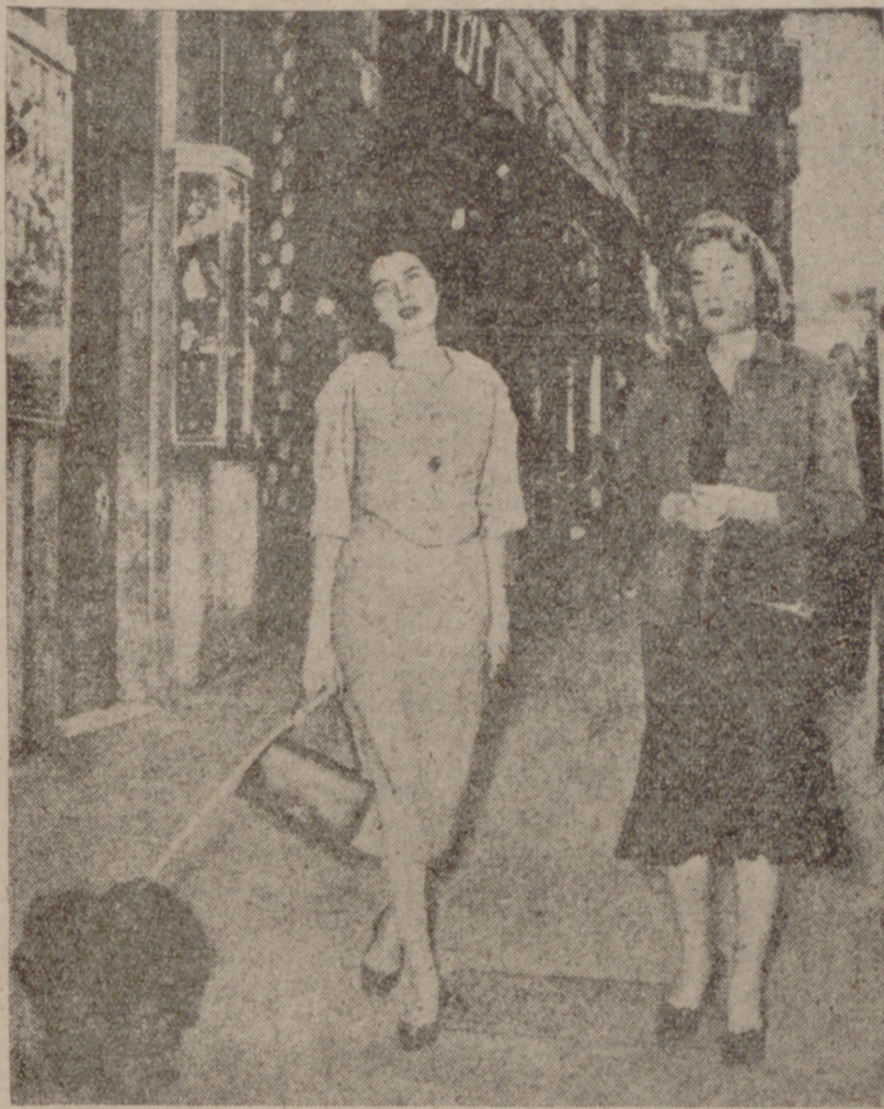
La emperatriz Soraya pasea melancólicamente por las calles de Roma. En su rostro se refleja la preocupación de que la Prensa mundial viene ocupándose desde hace largo tiempo. Junto a ella aparece su madre.