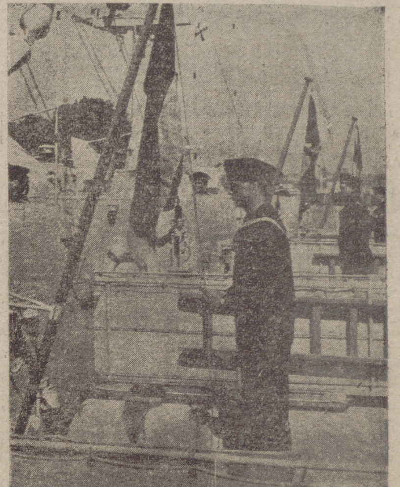
Los tres primeros barcos de la nueva Marina de guerra de la Alemania occidental han sido puestos en servicio. La ceremonia de izar la bandera se celebró en el puerto de Kiel. Las unidades pertenecen al tipo "3E", desplazan 130 toneladas cada una y llevan diecisiete hombres de tripulación.