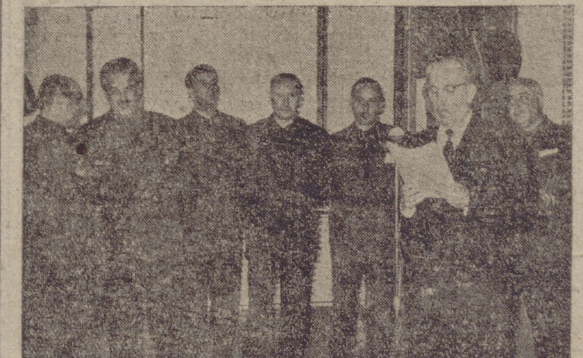
Madrid.—Un momento de la toma de posesión de los nuevos mandos sindicales bajo la presidencia del ministro de Trabajo, señor Girón.

Madrid, 17.—En el salón de actos de la Delegación Nacional de Sindicatos, y con asistencia del ministro de Trabajo, señor Girón, y del delegado nacional de Sindicatos, señor Solís, se celebró el relevo de mandos propuesto por el ministro secretario general del Movimiento y aceptado por el Jefe del Estado.