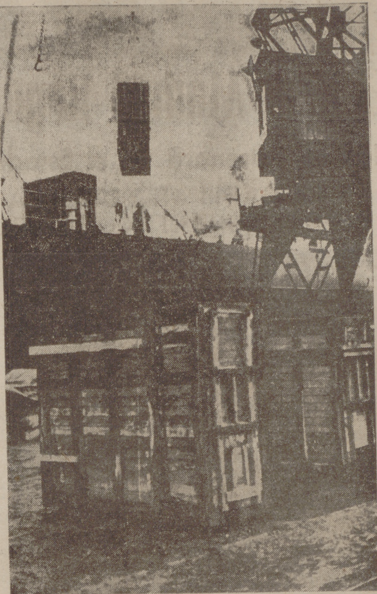
Santander.—Un momento del embarque en el vapor "Salamanca" de una partida de toros de lidia con destino a la plaza de toros de Lima. A la misma vez también se transportarán sacos de arena de la Maestranza sevillana para cubrir el ruedo de aquella plaza de toros.