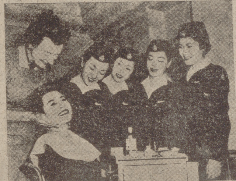
Hace poco publicamos la fotografía de estas muchachas japonesas como aspirantes a servir de azafatas en las líneas aéreas de su país. Ahora ya lo son y se entrenan en Londres. La verdad es que aquí visitan un instituto de belleza.