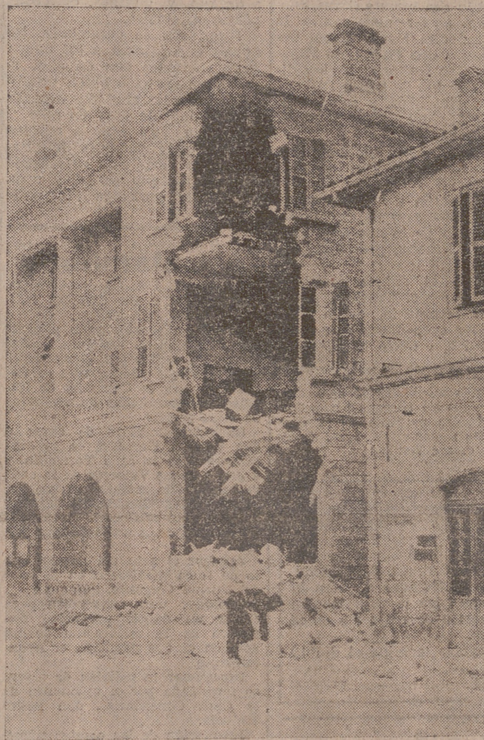
En Chipre continúa la ola terrorista desatada contra los británicos. La fotografía muestra los efectos de una bomba puesta por los patriotas en la Central de Correos de Nicosia.