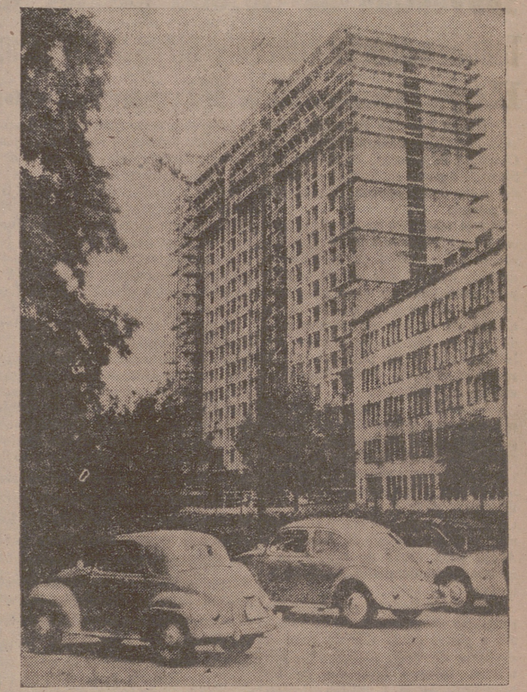
Berlin. — Crónica especial para la agencia «Fiel-Interpress» por Elisabeth Jerwitz.)

En breve volverá a ser la gran ciudad de antes de la guerra