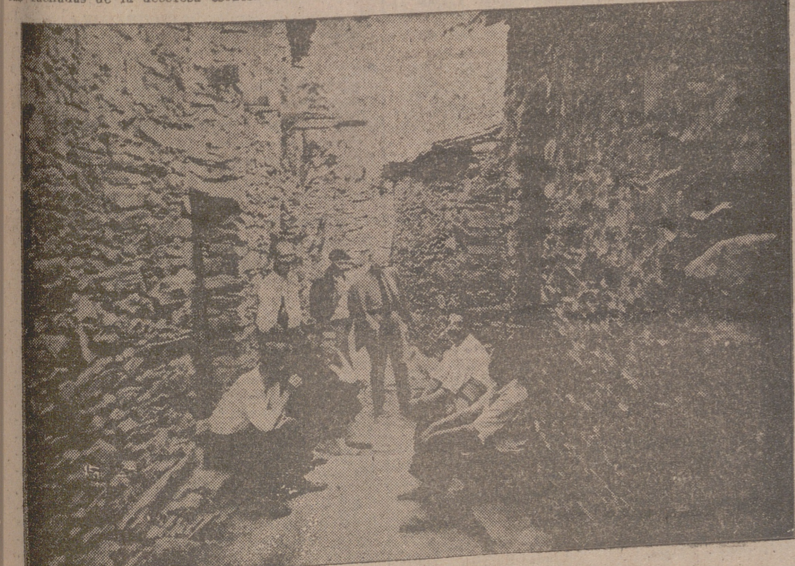
UNA CALLE DE FRAGORA

día de mi llegada a Ladrillar, uno de los cinco Ayuntamientos jurdanos, con mil ciento sesenta y ocho habitantes, según el nomenclador de hace cinco años. Esperaba hallar un pueblo en su verdadera sazón festiva.