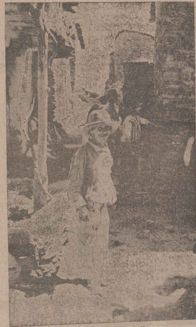
Personaje típico de la región.

de Ladrillar exhortan a los niños y adultos a una práctica de higiene: la limpieza de los dientes. Ya he dicho que era domingo el