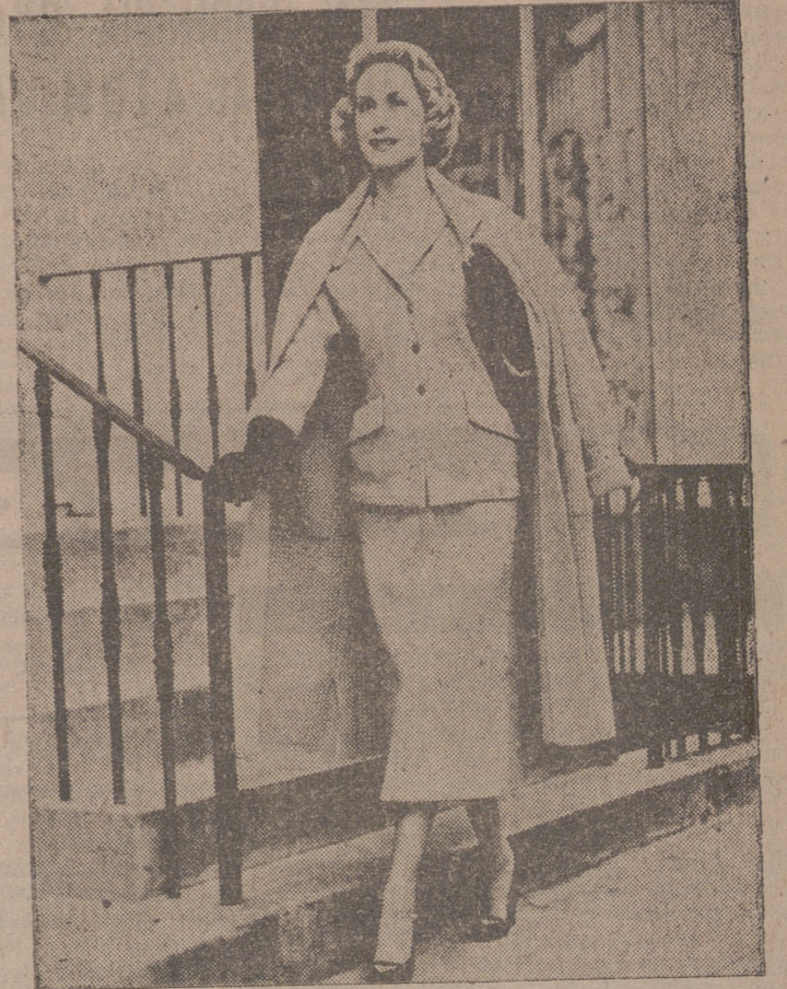
Atractivo traje de punto de lana, tejido a mano, con lunares amarillos y marrón sobre fondo beige. El abrigo es también de punto fabricado a mano.

SE fabrican los tejidos de acuerdo con las sugerencias de los creadores de la moda femenina o, por el contrario, éstos ajustan sus diseños al estilo de aquéllas. En realidad, dado el alto nivel a que se ha llegado en la industria textil, no puede suponerse que ésta se ajuste en líneas generales a dictados ajenos, puesto que en la actualidad cuenta con sus propios creadores, como lo demuestran las colecciones de estampados de más de una empresa británica, realizados por pintores de destacada personalidad. Sin embargo, no sería la primera vez que una casa de las llamadas de alto nivel haya solicitado de los fabricantes un determinado tipo de tejido para una determinada época de la temporada actual revelen una marcada tendencia hacia la verticalidad, es decir, el dibujo a rayas en este sentido. Entre éstos, los más atractivos son los de listas de colores suaves, destacándose sobre un fondo oscuro. En unos, las rayas —azules, verdes, amarillentas— aparecen de punto de lana gruesa; en otros las hebras dan la sensación de estar pasadas con una aguja. El aspecto de