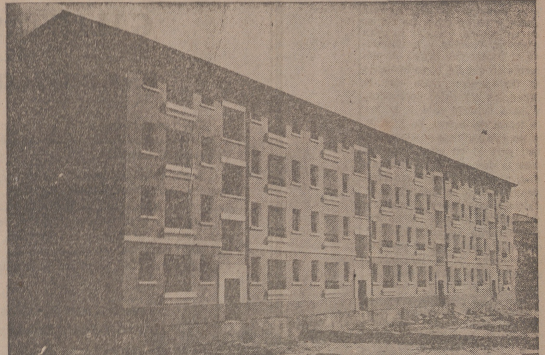
Grupo sindical "San Martín", en Laredo (Santander), con un total de 128 viviendas