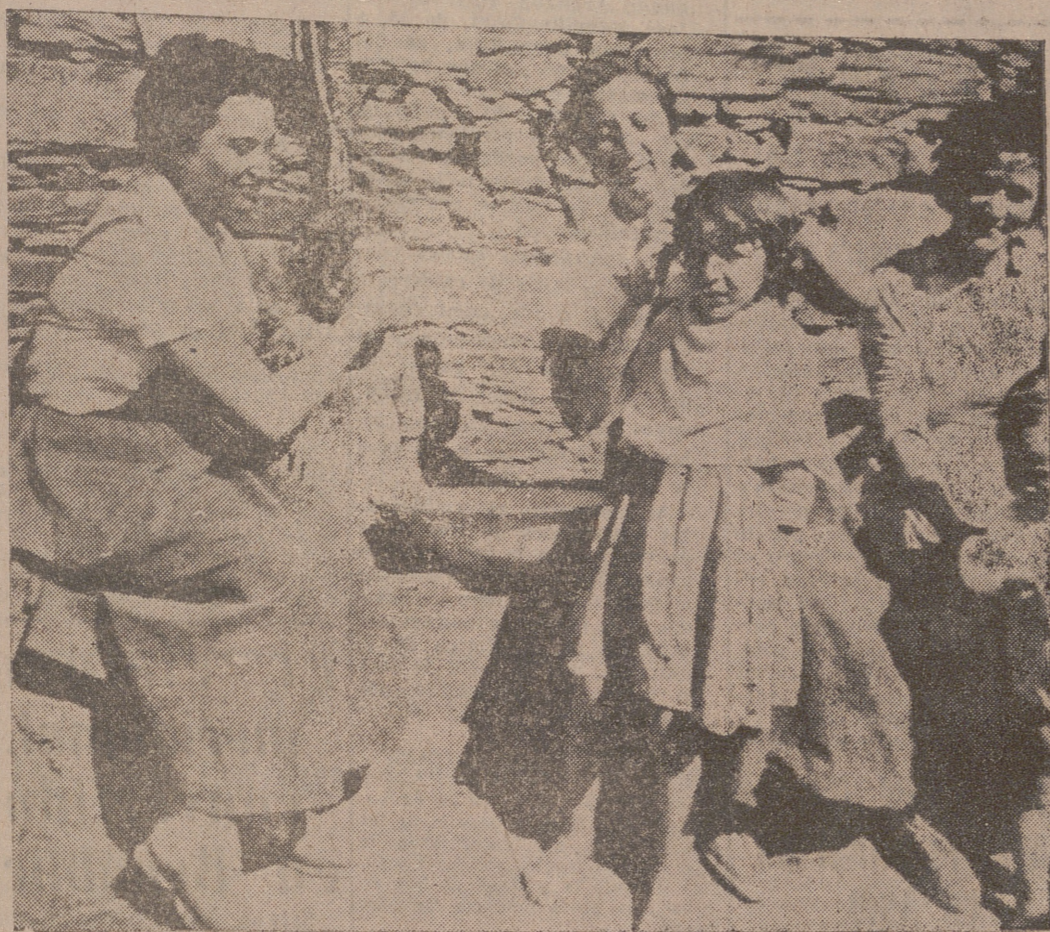
Comaradas de la Sección Femenina peinando a unas niñas de Ladrillar.

Fue así como entré en Ladrillar: por mediación de la Sección Femenina. Grandes carteles colocados en las fachadas de la decorosa escuela