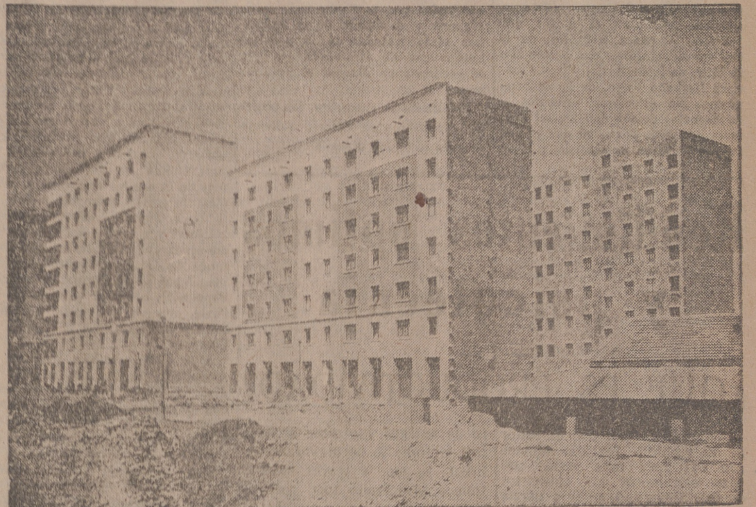
Grupo sindical "José Antonio Parer a" (San Pablo), de 412 viviendas