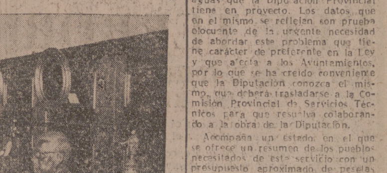
El Gobernador Civil y Jefe Provincial del Movimiento ha visitado la Exposición de Arte del Productor 1955 en el día de ayer, acompañándole el Delegado Provincial de Sindicatos, el Secretario de la excelentísima Diputación Provincial, el Vicesecretario de Obras Sindicales en funciones y el Secretario Provincial de la Obra Sindical «Educación y Descanso».

Elogio grandemente los objetos presentados y la elegancia y buen gusto de su ornamentación, saliendo gratamente impresionado del recorrido por el salón de artesanía y galerías de óleos, acuarelas, dibujo y fotografías.