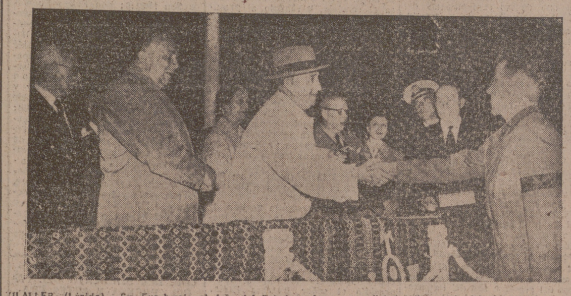
VALLADER (Lérida).—Su Excelencia el Jefe del Estado y las personalidades de su séquito durante la entrega de un grupo de viviendas destinadas a las familias de los mineros.