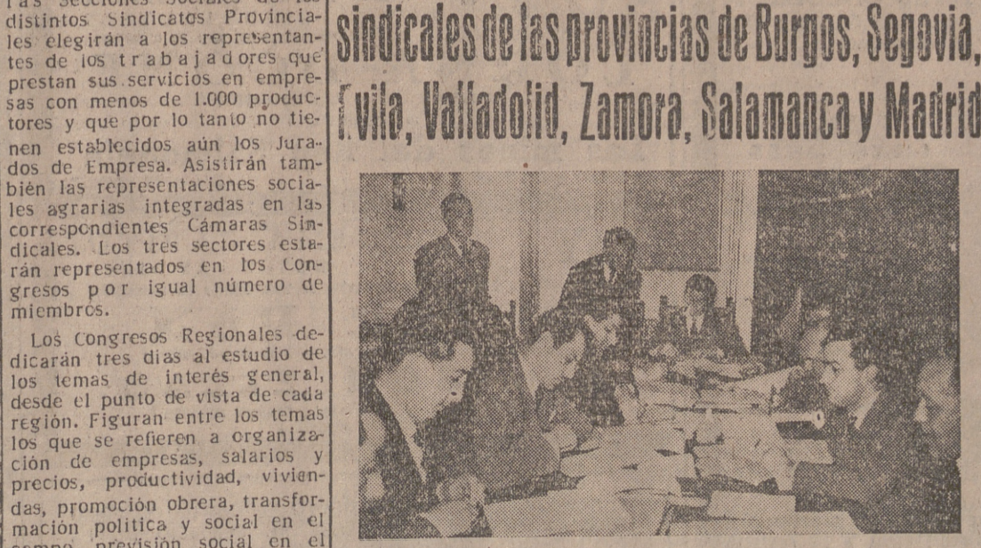
Un momento de la sesión celebrada ayer bajo la presidencia del delegado provincial de Burgos, a la que asistieron los mandos de las provincias de Valladolid, Zamora, Madrid, Avila, Segovia y Salamanca.

Al objeto de puntualizar sobre determinados aspectos fundamentales relacionados con las tareas a desarrollar en el próximo mes de abril por el Congreso Regional de Trabajadores de Castilla, en la mañana de ayer se celebró en la C.N.S. de Burgos una primera reunión de los delegados provinciales de Sindicatos y los vicesecretarios de Ordenación Social de las provincias de Burgos, Avila, Segovia, Valladolid, Zamora, Salamanca y Madrid. Por las jerarquías sindicales de las siete citadas provincias se trató ampliamente y en términos generales de todo lo concerniente con este importante Congreso social, llegándose a un acuerdo sobre la distribución por provincias de las diferentes ponencias que han de ser discutidas en el mismo. Se comentaron y criticaron los trabajos ya realizados en relación con dichas ponencias, siendo, en último lugar, confeccionado y aprobado el programa por el que ha de regirse el expresado Congreso. Los delegados y vicesecretarios de las provincias aludidas aprovecharon esta reunión para cambiar impresiones sobre otros problemas de índole sindical que son comunes a las mencionadas provincias.