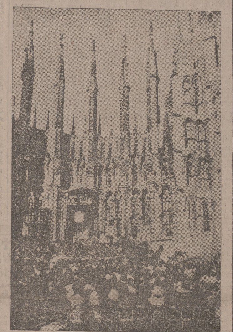
En Barcelona, con motivo de la festividad de la Sagrada Familia, se celebró en el templo barcelonés de este nombre la ceremonia de colocar la primera piedra de una nueva torre, acto que fué precedido por una solemne misa de campaña.