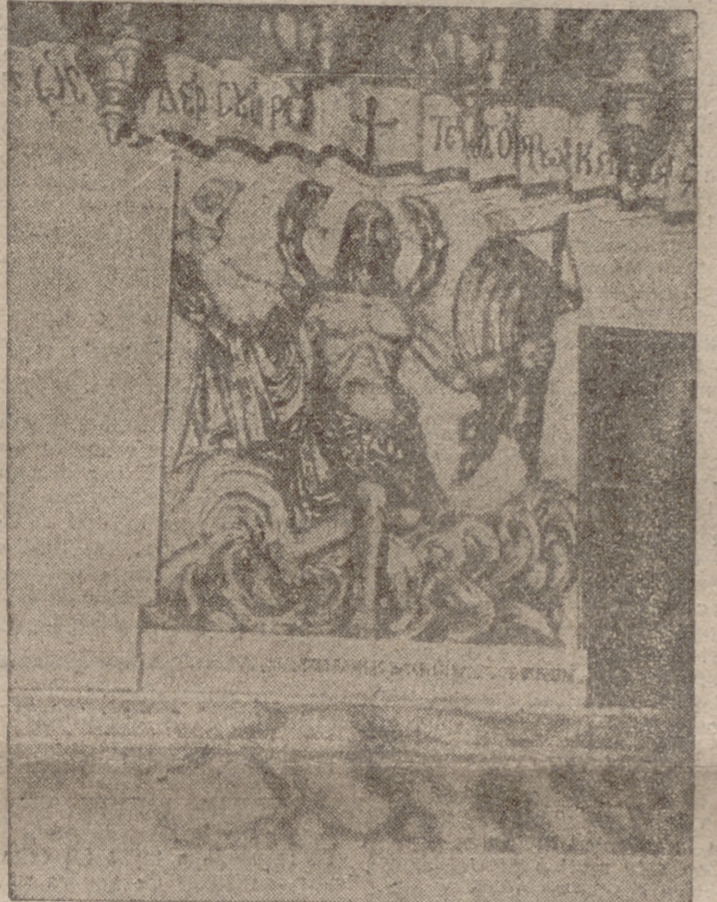
La fotografía reproduce la copia exacta del interior del Santo Sepulcro que figura en la gran Exposición de Tierra Santa inaugurada ayer por el Jefe del Estado.

Mensaje del Papa con motivo de la apertura del Certamen sobre los Santos Lugares