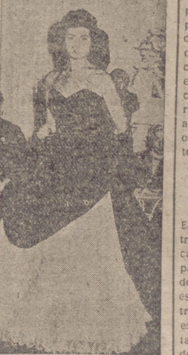
Sin duda, la moda femenina ya no es una exclusiva francesa. He aquí este modelo presentado recientemente en Madrid por una casa española. No habrá que decir que obtuvo un gran éxito.