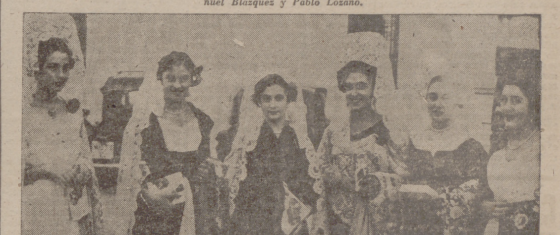
Unas presidentas de cusiana...

Por imperativos de la vida, la fiesta de los toros en el reverso de su traje de luces esconden valores de la mejor y más humana calidad. Una intimidad emocional, fundida en el crisol de un amargo, de lo difícil. Por eso los toreros son hombres buenos de corazón que no olvidan la virtud de los sentimientos nobles. Y cuando traspasan las cimas del triunfo, cuando llegan a coger los cuernos de la vida para ceñirlos a su media verónica, en el dominio que lo hacen elegidos.