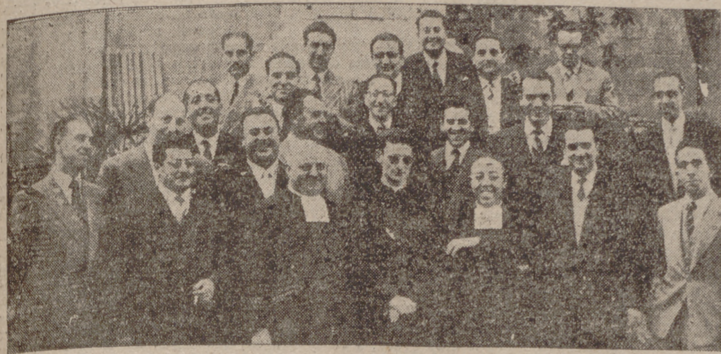
Grupo de antiguos alumnos de Lourdes, que se reunieron en el Colegio para oír misa y luego celebrar una comida en el Círculo de Recreo.

Ayer se reunieron en el Colegio de Nuestra Señora de Lourdes los antiguos alumnos pertenecientes a la promoción de bachilleres de 1939, para celebrar con diversos actos el XV aniversario de la terminación de sus estudios en el Colegio.