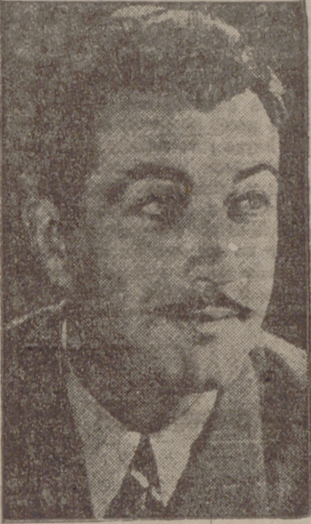
Robert Taylor, el célebre actor cinematográfico.

Durante la guerra actuó como entrenador de pilotos, pero confiesa que le gusta mucho más hacer películas.