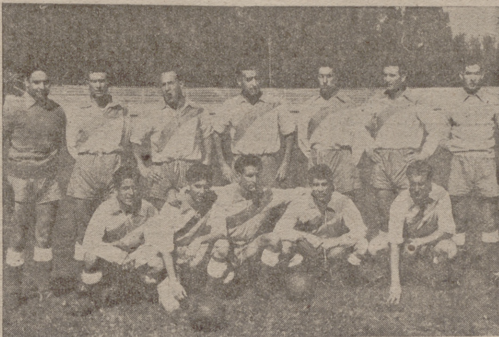
EQUIPO DEL EUROPA DELICIAS

Plaza de los Leones de Castilla, 10-Teléfonos 4410, 4418 y 4419 - VALLADOLID