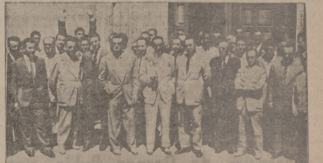
Autoridades, directivos, jugadores y aficionados, a la salida de la misa, que se celebró ayer en la iglesia de San Lorenzo.

Directivos y jugadores asistieron ayer a una misa en San Lorenzo. Importantes obras en el Estadio. Hoy comienzan los entrenamientos.