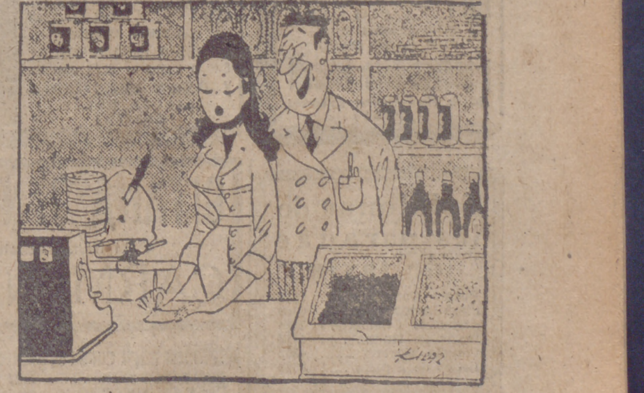
—Nunca le había dicho que tienes los ojos como dos ciruelitas clase superior, a 40 pesetas kilo.

Lisboa, 11.—Se sabe que el Gobierno de Venezuela ha expresado públicamente su solidaridad con Portugal con respecto a la India. El ministro de Negocios Extranjeros ha enviado a la Prensa de su país una declaración en este sentido.—Efe.