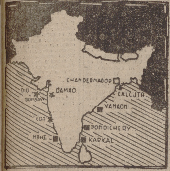
Mapa de la India, en el que se señala la situación de los territorios portugueses de Goa, Diu y Damão (marcados con una estrella). También figuran las posesiones francesas (marcadas con un cuadro).

El subjefe de la Policía portuguesa en Dadra murió apuñalado