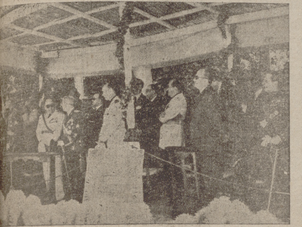
La tribuna de honor con autoridades de Valladolid, Zamora y Salamanca.