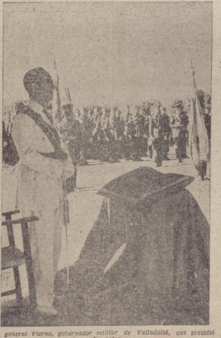
El general Vierna, gobernador militar de Valladolid, que presidió los actos.

Guatemala, 2. — A última hora de la tarde se ha llevado a cabo un intento para negociar una tregua entre las fuerzas del Ejército Regular guatemalteco y las del Ejército de Liberación, que se encuentran empeñadas en una dura lucha. Se informa que Castillo Armas ha apelado a los jefes militares regulares para que den la orden de alto el fuego, pero ha sido desestimada su demanda. A las 21,30 —hora española— se reanudó la batalla. Intervinieron en la lucha los aparatos de bombardeo "Thunderbolts P-47", empleados en la lucha contra el régimen de Arbenz. No hay noticias concretas sobre el curso de la batalla entablada. Los mandos del Ejército Regular aseguran haber ocupado una base aérea controlada por el Ejército de Liberación, pero no hay nada confirmado sobre la situación, tanto en detalles aislados como en su aspecto general.—Efe.