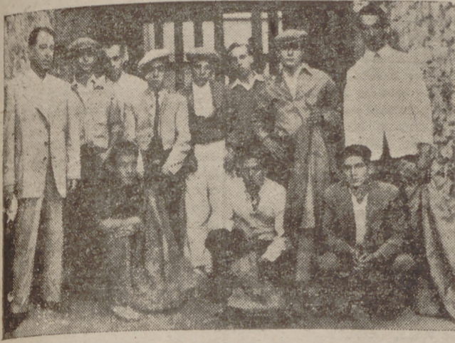
Cuadrilla del gremio de Hostelería que lidiaron dos becerras.

Anteayer, ¿otra revelación?... El homónimo