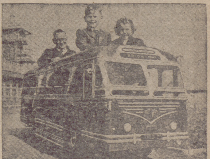
Este diminuto autocar destinado a conseguir la felicidad de los niños, ha sido construido por el señor que posa en la foto junto a sus dos pequeños clientes. El autocar desarrolla velocidades notables.