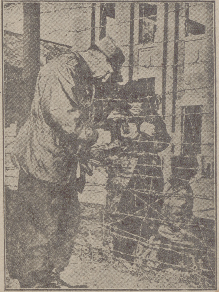
Patética estampa de un campo de internados para viudas e huérfanos, en Inchon. Un norteamericano socorre con botes de conserva a esa pobre mujer.

“Puente marítimo” desde el Báltico al Vietminh Se considera inevitable la caída de la sitiada fortaleza