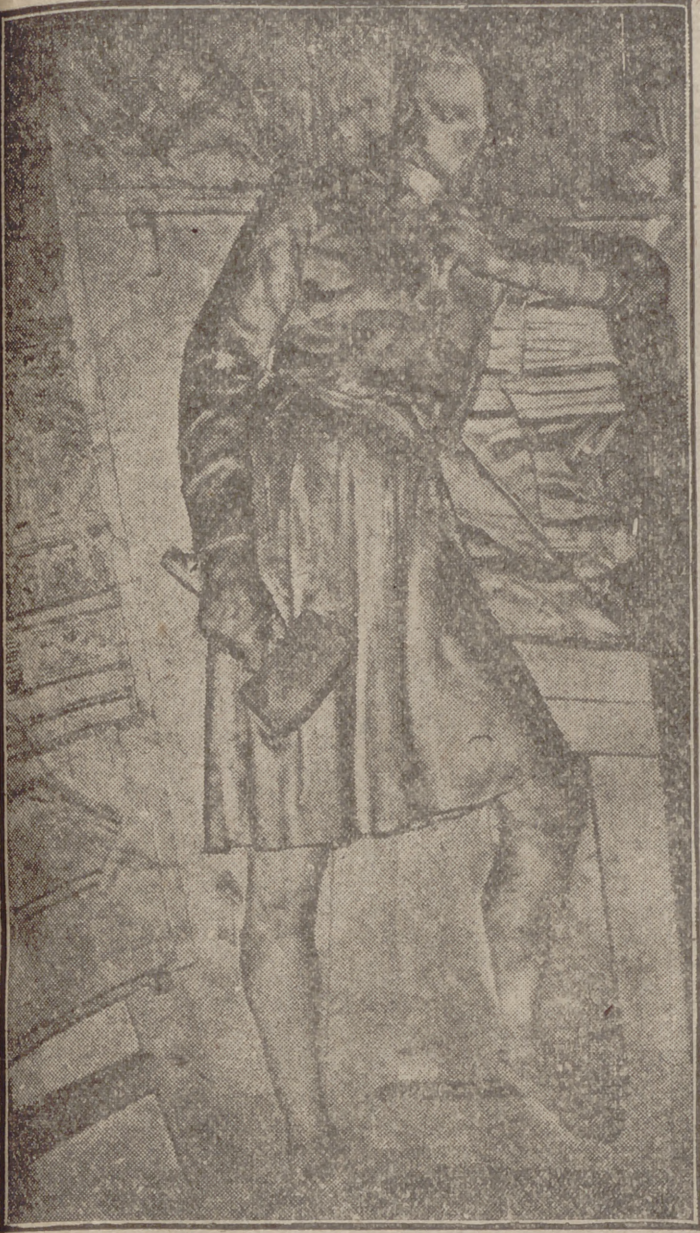
"BERRUGUETE EN SU TALLER" Bajo relieve composición de la Escuela de Artes y Oficios de Valladolid.

ido llenándose con la geometría bella del jardín, donde ya comienzan a retoñar los esquejes plantados en la tierra negra, recordaba, el anillo blanco de los asientos pétreos, el que aparece en el ojo del viejo alrededor del cristalino signo de senectud, llamado «gerontoxona»; en fin, estaba clamando rejuvenecimiento, y fué escuchado su clamor y suplica.