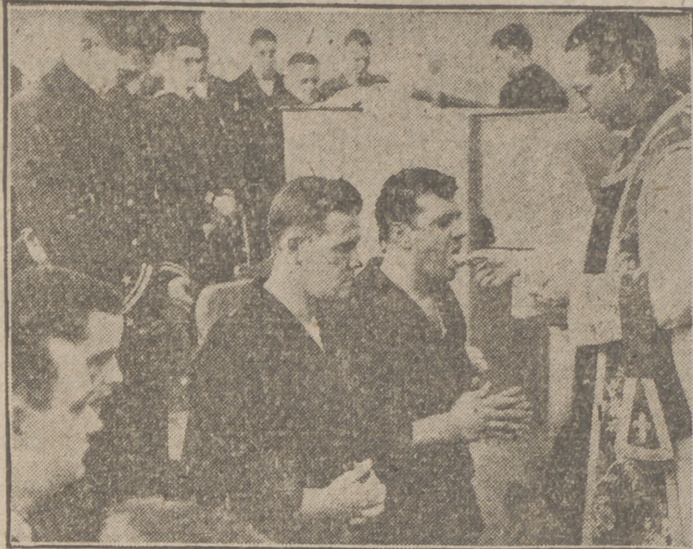
Málaga. — Con motivo del Domingo de Ramos fué pedida al señor Obispo una misa a bordo del buque norteamericano "Libra", a petición de los numerosos marinos católicos de la flota que se encuentra en este puerto. Un momento de la Comunion.