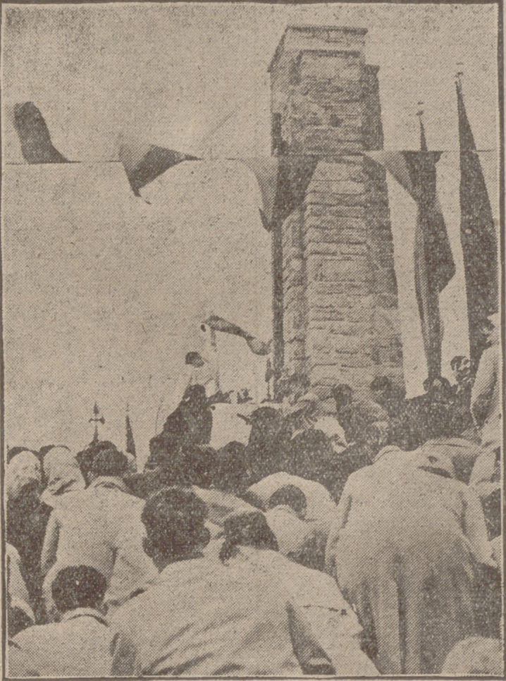
Zaragoza. — Comemoración de la gesta de Alcuibierre, donde se cubrieron de gloria las Banderas séptima y tercera de la Falange de Aragón.