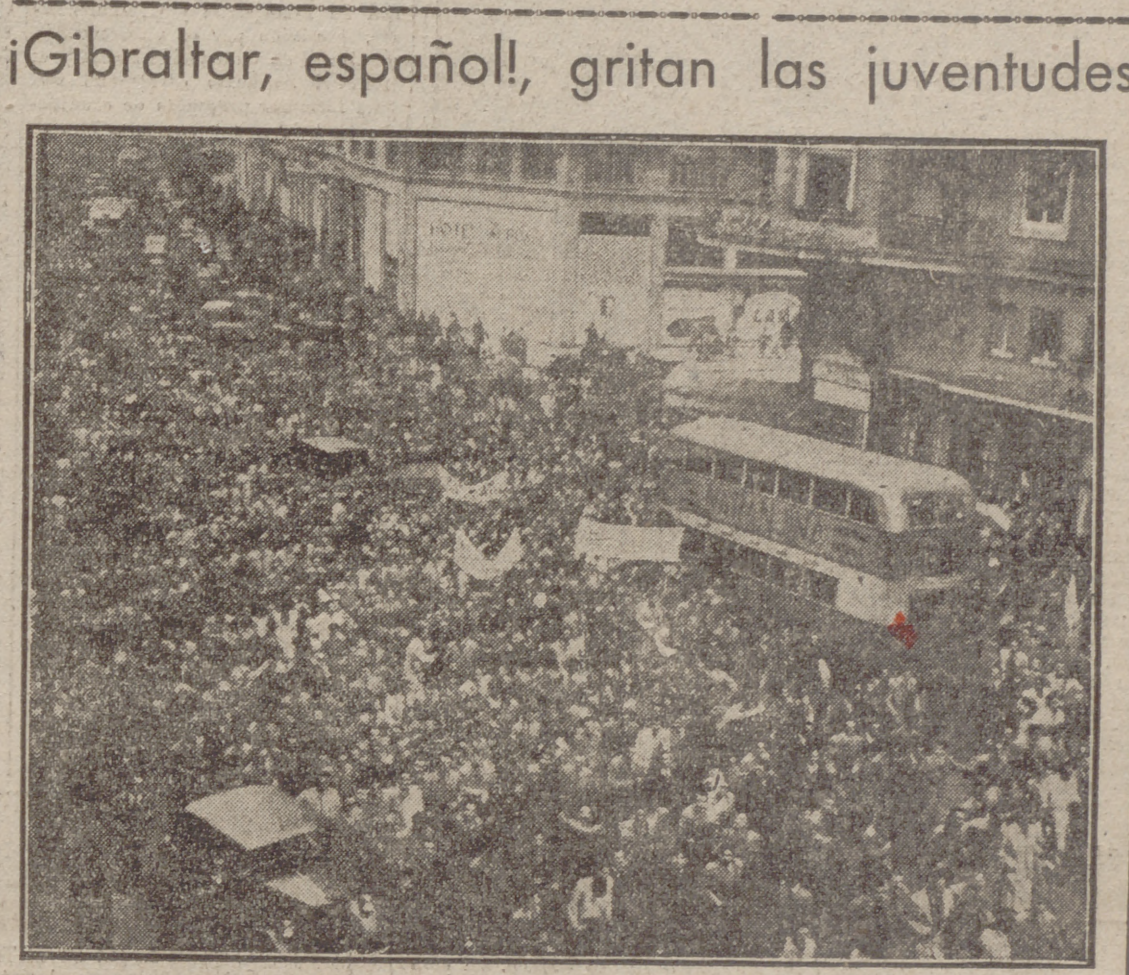
Una gran manifestación juvenil, iniciada por los estudiantes, recorrió las calles de Madrid al grito de "Gibraltar español!" A los estudiantes se unieron millares de ciudadanos que quisieron expresar su apoyo a la política exterior de nuestro Gobierno. Una de las pancartas que llevaban los manifestantes, decía: "Reina Isabel, ten cuidado".

A los estudiantes se unieron millares de ciudadanos que quisieron expresar su apoyo a la política exterior de nuestro Gobierno. Una de las pancartas que llevaban los manifestantes, decía: "Reina Isabel, ten cuidado".