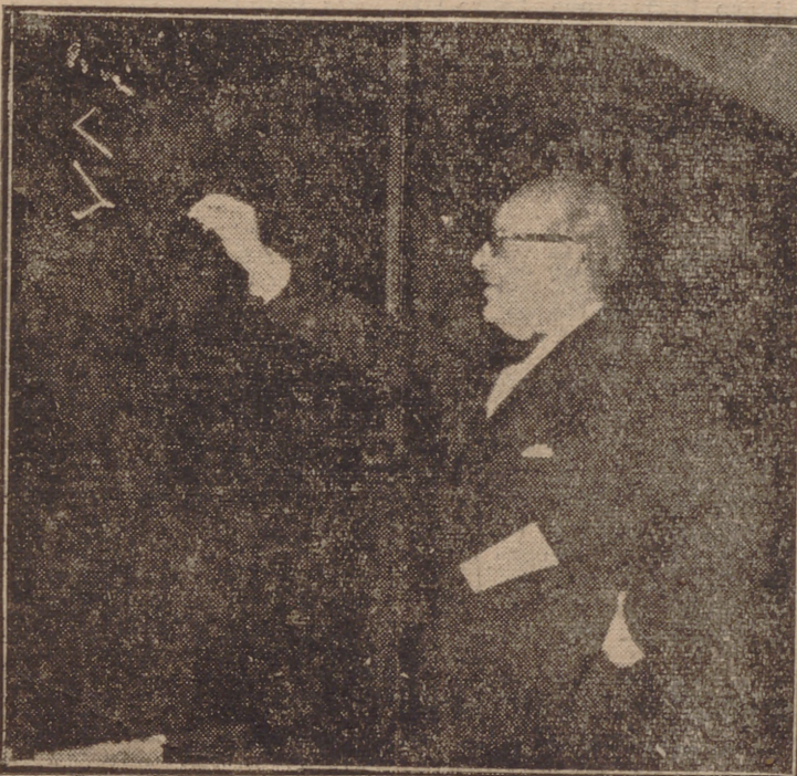
En Las Palmas se ha celebrado la primera fase del Tercer Congreso Nacional de Alergia, al que han asistido, presididos por el profesor Jiménez Díaz, numerosos médicos nacionales y extranjeros. El profesor Jiménez Díaz en una de sus actuaciones.