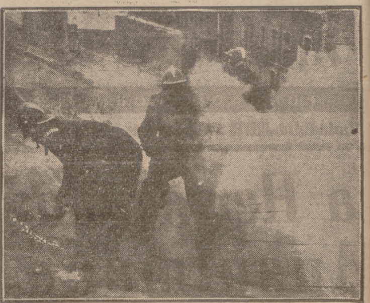
Carvajal ha captado a varios de los bomberos efectuando los trabajos de extinción del incendio en el tejado.

A la una de la tarde de ayer, en la casa número 21 de la calle Santa María, se produjo un incendio, quemándose la cubierta del tejado. En los primeros momentos cundió la alarma entre la vecindad, interviniendo activamente los vecinos, que lograron mitigar el fuego hasta la llegada del Servicio de Bomberos, que lo extinguió por completo.