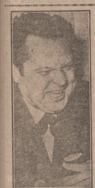
(Pasa a la página cuarta)

Reunión del Consejo de Ministros Pasan a las Cortes diversos tratados para su ratificación Numerosos expedientes de Obras Públicas El Consejo Provincial cumplimenta al señor Arzobispo