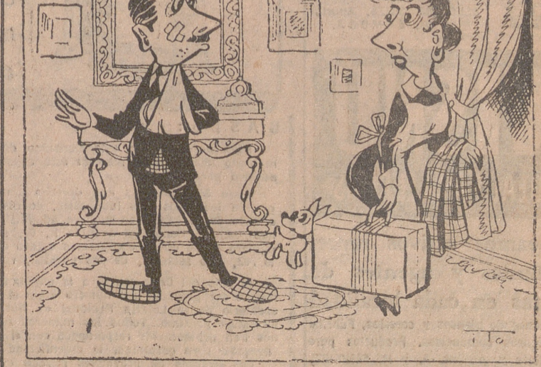
—Me voy porque me ha levantado la mano la señorita. —No sea tonta. ¿No ve cómo yo no me voy?