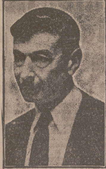
La figura más prestigiosa y popular de la natación española, campeón y padre de campeones, don Enrique Granados, que ha fallecido, llenando de consternación a los círculos deportivos nacionales.