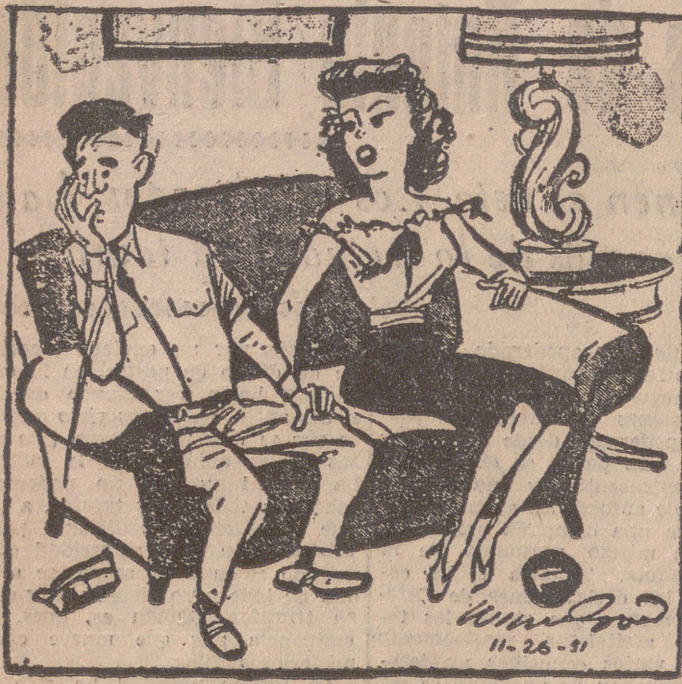
En tus cartas decías que me echabas de menos. ¡Olvídate ahora a tu sargento y demuéstrelame!