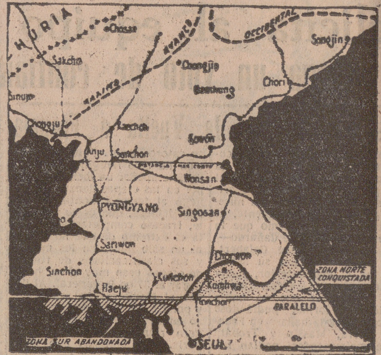
Situación de la línea de contacto de los dos Ejércitos en el momento de firmarse el armisticio. Una parte del territorio, situado al sur del paralelo 38 queda en poder de los rojos...