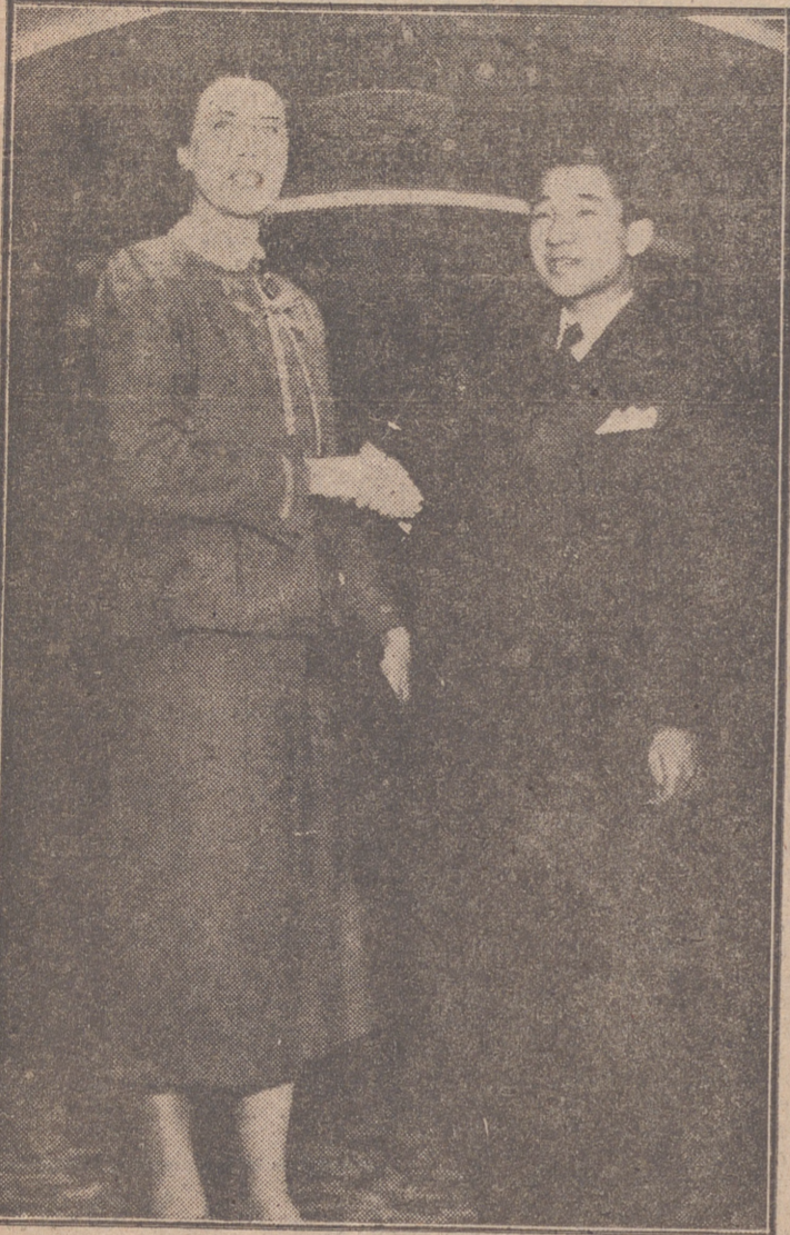
Nueva York.—El príncipe Aki-Hito, acompañado de una de sus profesoras, en el hotel donde se hospedan, durante su visita a esta capital.—El heredero japonés vendrá próximamente a Europa y visitará España.

EL PUESTO DE BANNABAY, EN PODER DE LOS COMUNISTAS Hanoi, 29.—El puesto franco-laoiano de Bannabay ha sido capturado por elementos del Vietnam, a 65 kilómetros al norte de Luang Prabang. No se tienen noticias de su guarnición, formada por sesenta hombres.—Efe.