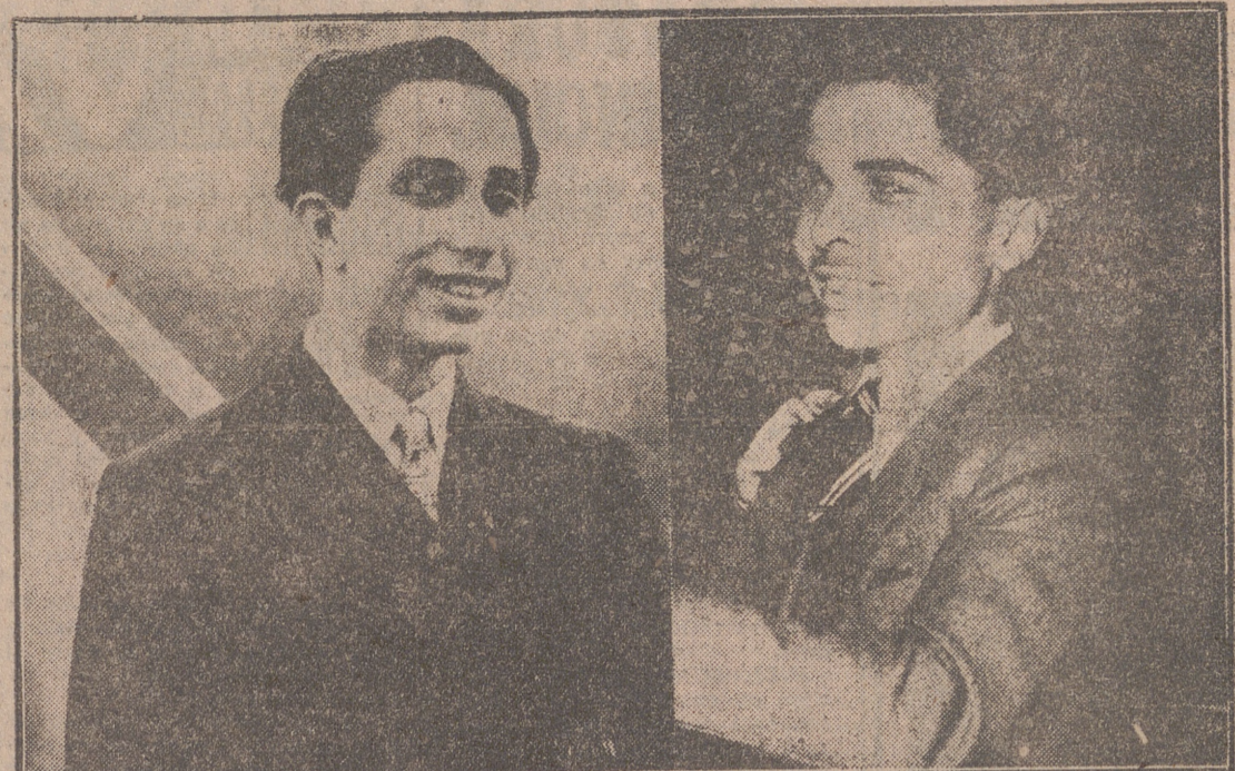
A la izquierda, Faisal II de Irak; a la derecha, Hussein de Jordania, que dentro de muy pocos días serán coronados como reyes de sus respectivos países.