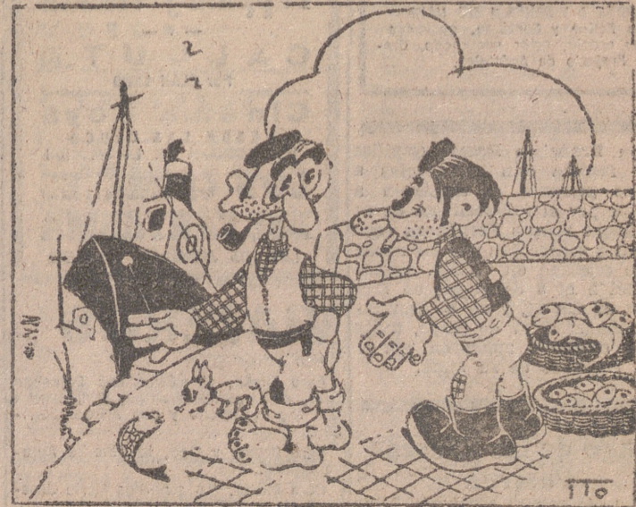
—Ya verás cómo gana el Valla dollid. —¡Claro, si aquí no sacas la espina, no sé donde mejor la vas a sacar!