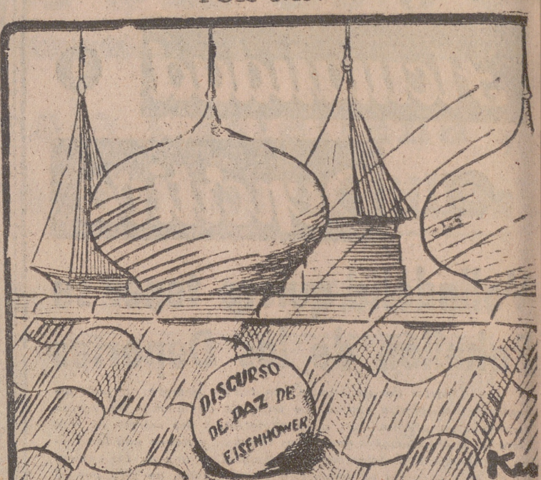
—Ahora sí que está la pelota en el tejado!