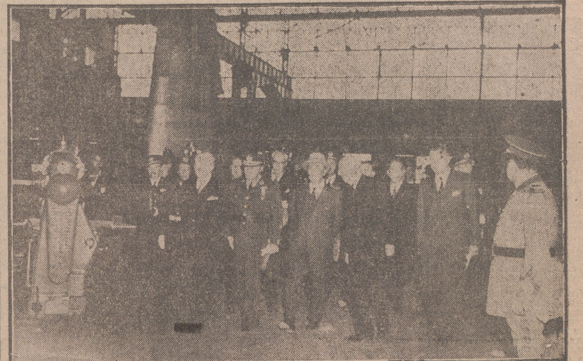
SEVILLA.—S. E. el Jefe del Estado, acompañado del ministro del Aire y de otras personalidades, durante su visita a la Factoría Sevilla, de Co. Construcciones Aeronáuticas.

FRANCO acepta el nombramiento de Doctor "Honoris Causa" de la Universidad de Sevilla