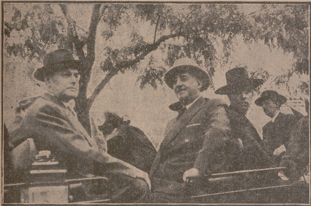
SEVILLA.—S. E. el Jefe del Estado, acompañado del ministro de la Gobernación, en el coche de caballos enajenados a la andaluz durante su paseo por el Real de la Feria. A lo largo de todo el trayecto escuchó las ovaciones del público.

El ministro de Agricultura comparó la obra realizada por los viejos partidos y por nuestro Movimiento El Caudillo y los ministros que le acompañaban fueron recibidos con grandes muestras de alegría y entusiasmo