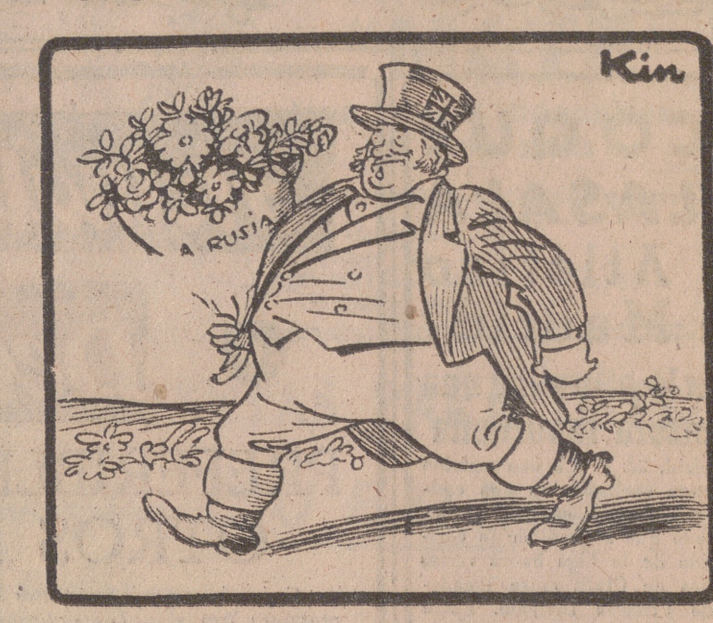
—También nosotros estamos dispuestos a llegar "a mitad de camino". ¡Adonde no estaríamos dispuestos a llegar es al final!