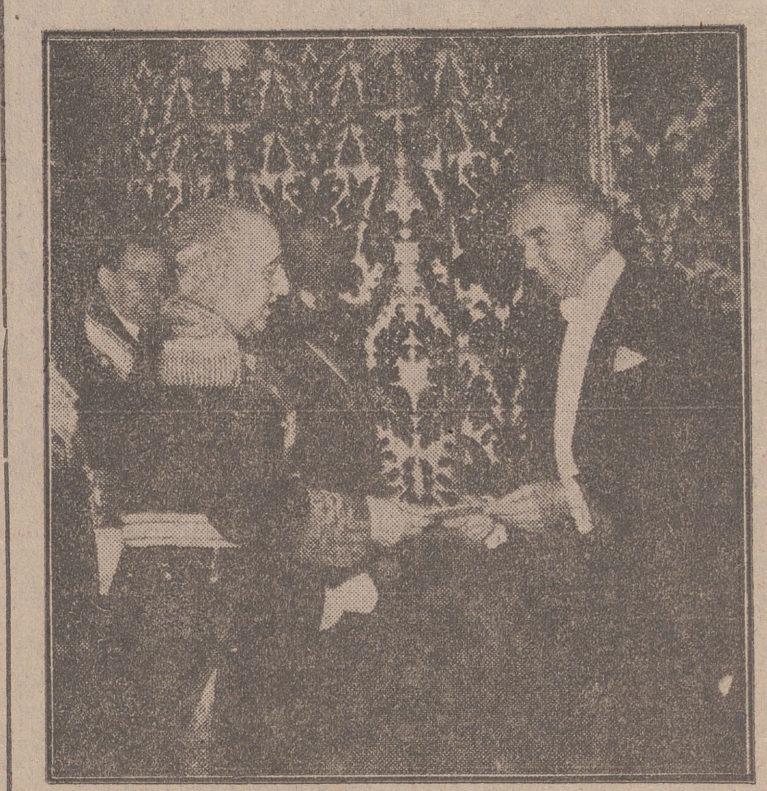
MADRID.—Su Excelencia el Jefe del Estado durante el acto de presentación de cartas credenciales del nuevo embajador de los Estados Unidos.