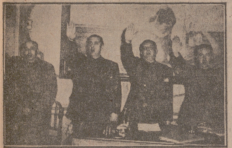
La presidencia del acto, cantando el "Cara al Sol" al final.

"Tenemos que conseguir que nuestra Revolución, en lo económico y en lo social, sea un hecho", dijo el jefe provincial