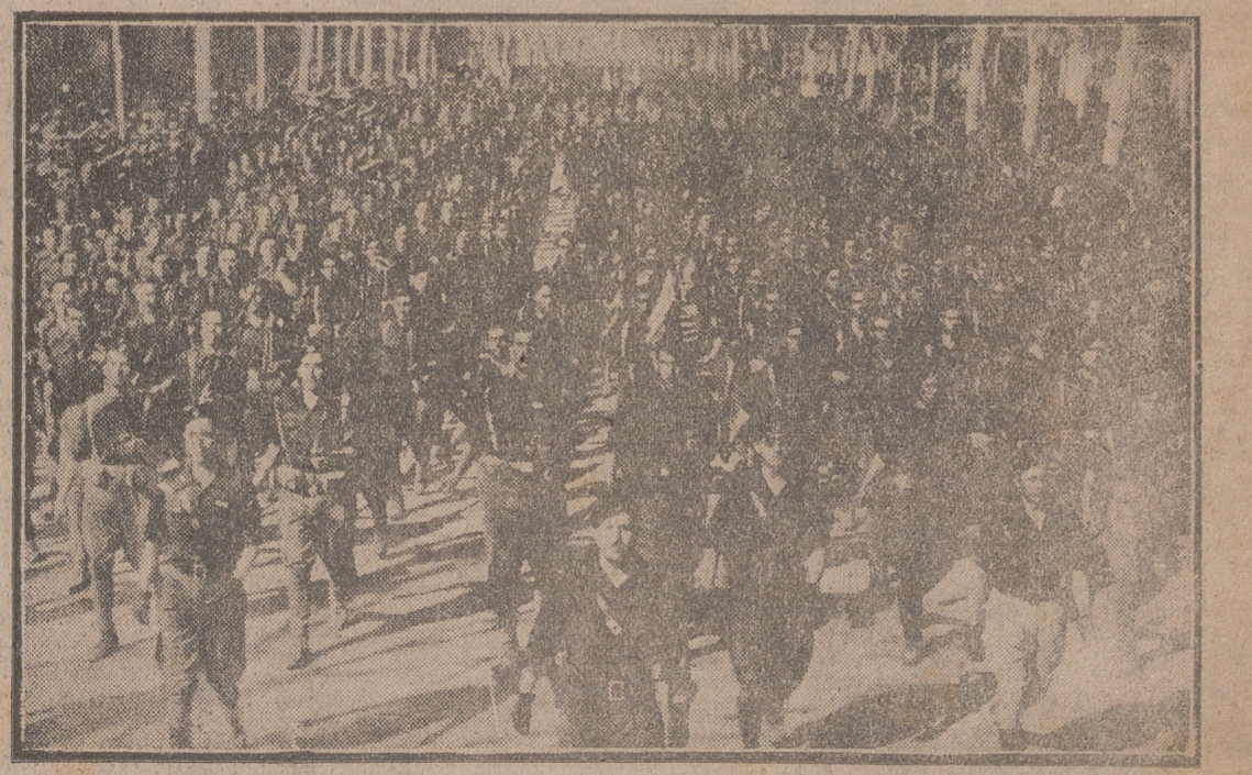
Aquellas centurias múltiples de la guerra, que asombraron a las tierras de España con su heroico esfuerzo, nos han dado una buena parte de la paz actual. Lo que entonces fue un tor militar se ha hecho para bienestar de los españoles manantial de realizaciones prácticas. A la hora de conmemorar la Victoria no podría faltar aquí la presencia de nuestros camaradas.