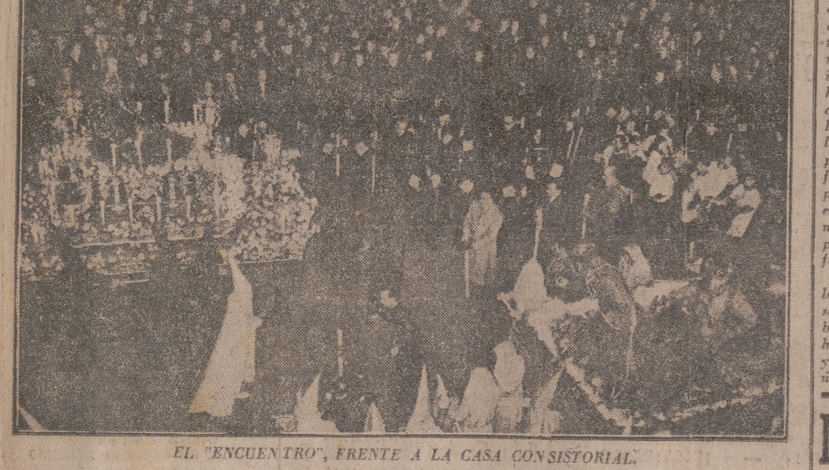
EL "ENCUENTRO", FRENTE A LA CASA CONSISTORIAL.

Hoy saldrá la del solemnísimo VIA-CRUCIS