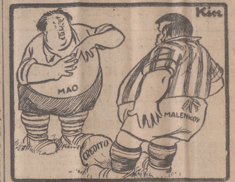
MAO: —¡No creas que vas a engañarme como a un chino!