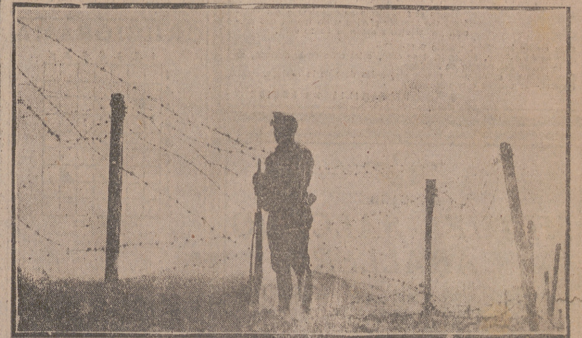
Este soldado español, corto de carnes y de estatura, vigila y guarda hoy, como vigiló y guardó ayer, la paz y el sosiego de España y de Europa. Aunque él no lo sepa, es verdad. Más allá de las alambradas está Europa, un poco dejada de la mano de Dios. Al lado de acá, la vertiente alébrica del Pirineo: la seguridad, el orden, las únicas posibilidades defensivas de la cultura cristiana. En una palabra: la última y decisiva frontera de Europa frente al comunismo, fielmente defendida por el quinto español del gorrillo ladeado.