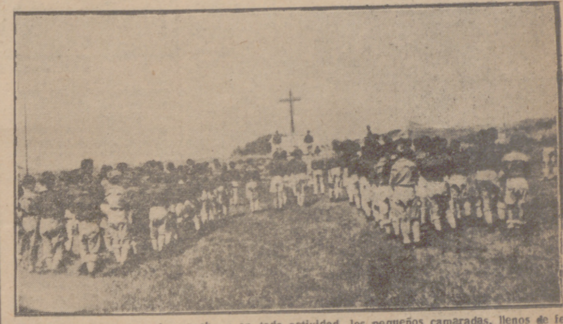
En el Campamento, en la marcha y en toda actividad, los pequeños camaradas, llenos de fe y de virtudes, cumplen con sus deberes religiosos, como en este momento de la vida del Campamento dedicado a los afiliados de la provincia en el verano pasado

Organización para la provincia. Unidades y elementos fundamentales. PROYECTOS DE UNA NUEVA ETAPA