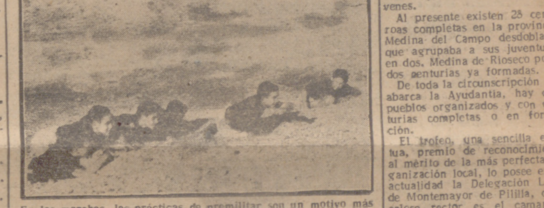
En las marchas, las prácticas de premilitar son un motivo más de recreo y de formación.