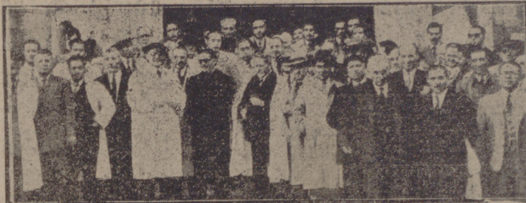
Asambleistas y autoridades a la salida de la misa del Santuario

Ayer se reunieron en Valladolid en Asamblea General los representantes de los Cuervos, para honrar a su Patrona, la Virgen del Pilar, y cambiar impresiones sobre las nuevas reglamentaciones de la Ley de Régimen Local.