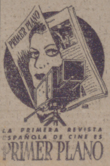
LA PRIMERA REVISTA ESPAÑOLA DE CINE ES PRIMER PLANO