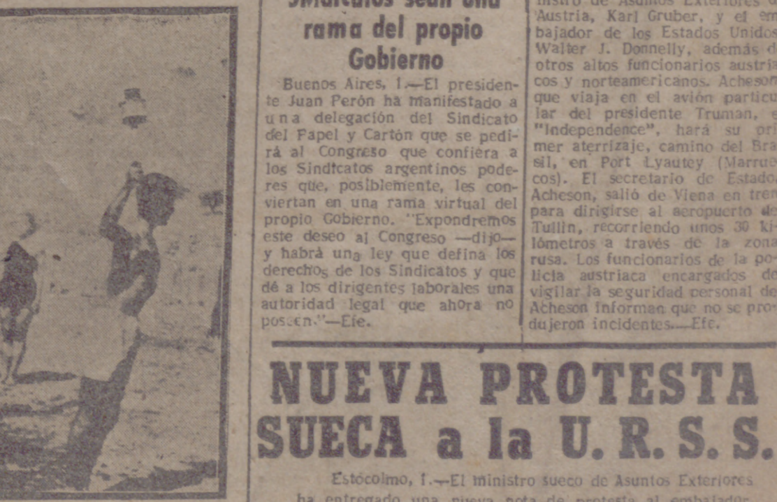
MONTE OLIMPO (Grecia). — Cuatro atletas ante el altar de Olympia durante la ceremonia de encender la antorcha que lucirá en los Juegos de Helsinki. Llevada en avión especial hasta Copenhague y desde aquí, el fuego sagrado será conducido hasta Helsinki por 342 corredores distribuidos a lo largo del trayecto.